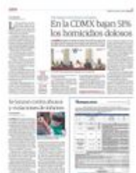
UNA NIÑA participa en una protesta del Día Internacional de la Mujer, en 2020.