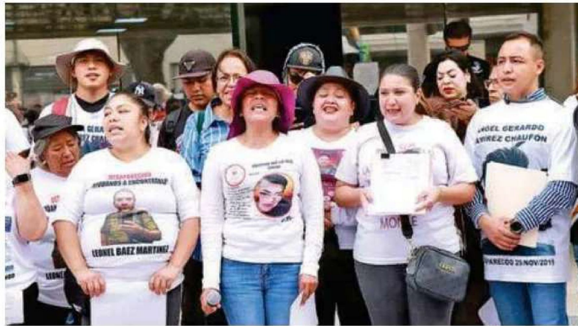
Entre los hechos denunciados se encuentran la manipulación "lúdica e irrespetuosa" de restos humanos por parte del personal del lugar

“El respeto a las personas fallecidas es también un derecho de quienes seguimos buscándolas. La dignidad no se pierde con la muerte, y la memoria de quienes amamos no puede ser tratada con burla ni desdén por quienes deben garantizar justicia. Porque esta indolencia no solo atenta contra la dignidad de las personas fallecidas, contribuye a que se exacerbe la crisis de identificación forense. Exigimos dignidad, incluso después de la vida, por todas las personas que hoy siguen desaparecidas”, finalizaron.