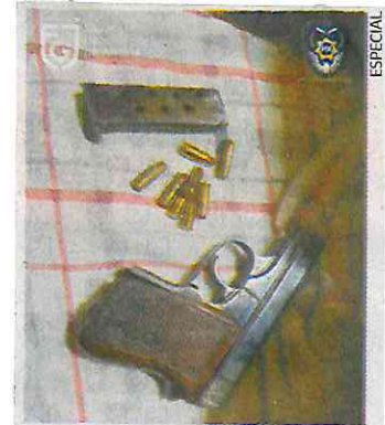
En el departamento se encontraron diversas armas.

El operativo fue producto de un trabajo de inteligencia tanto de la Secretaría de Seguridad Ciudadana (SSC) como de la fiscalía local. Un agente del Ministerio Público de la Fiscalía de Investigación del Delito de Narcomenudeo solicitó y obtuvo de un juez la orden de cateo correspondiente para el inmueble, en el que participó el Grupo Especial de Reacción e Intervención. ●