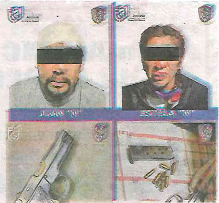
Fueron aseguradas armas de fuego con cargadores y diversas dosis de probable cocaína y mariguana

También fueron asegurados tres cargadores de arma de fuego, cerca de 19 dosis en papel de sustancia sólida color blanco; más de 50 dosis de polvo blanco en bolsas de plástico y aproximadamente 17 dosis de vegetal verde con caracteristi-