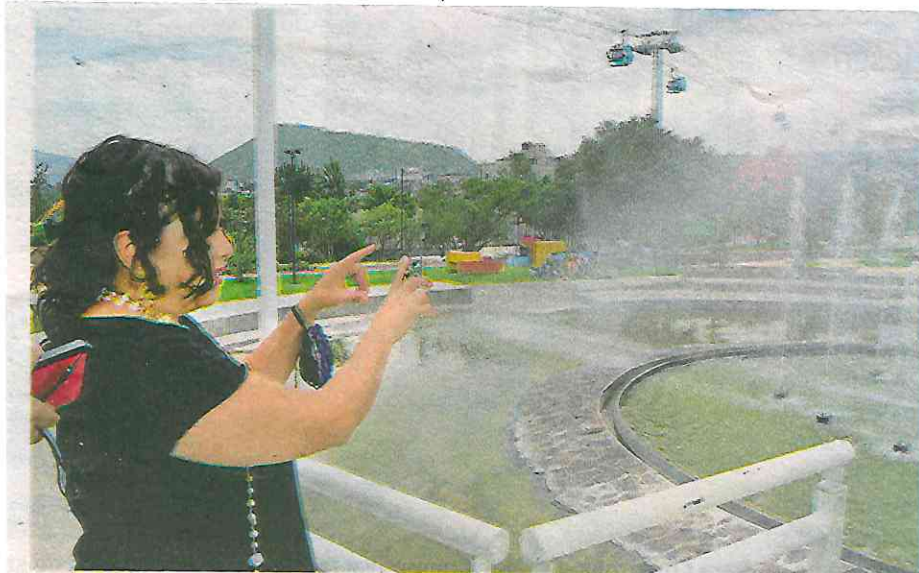
Aplica la alcaldesa Clara Brugada estrategias contra la inseguridad