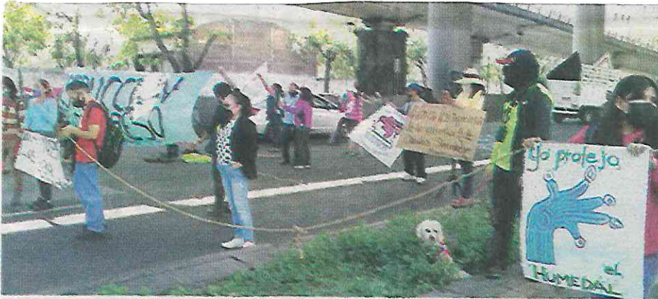
Integrantes de los pueblos, en una de las manifestaciones en defensa del humedal