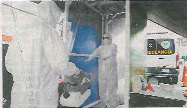
Después de cada servicio, personal del ERUM desinfecta su equipo y trajes, para estar prevenidos en caso de una nueva emergencia.