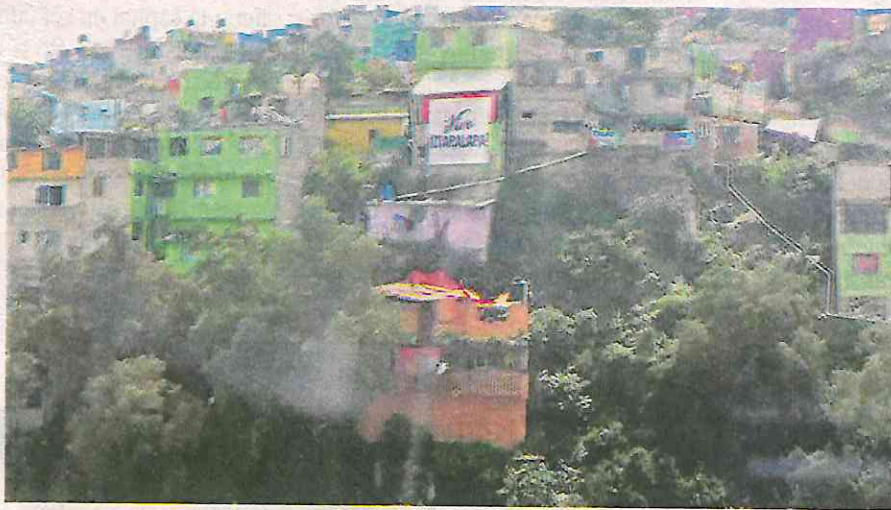
Desde los techos vecinos de la zona oriente presenciaron el arranque del Cablebús Línea 2; así lució la frase: "¡Vive Iztapalapa!"; el muralismo se hace presente en el proyecto