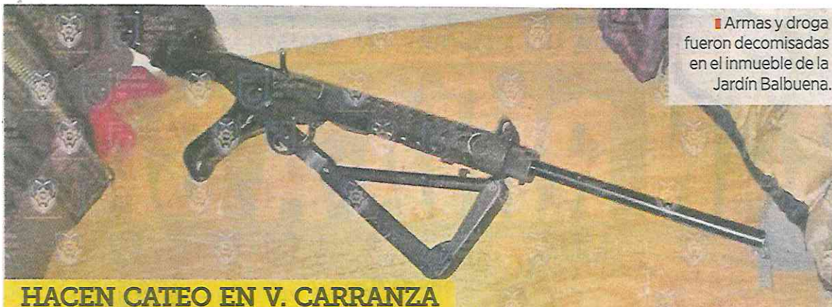
Armas y droga fueron decomisadas en el inmueble de la Jardín Balbuena.