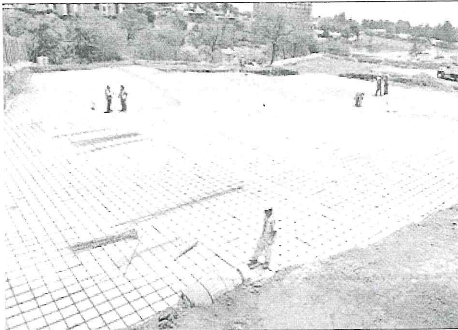
▲ Aspecto de los trabajos de cimentación de lo que será el Hospital General de Cuajimalpa, el cual será de tres niveles de altura.