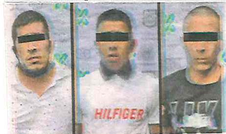
Uno de los detenidos cuenta con un ingreso al Sistema Penitenciario en 2007

Al realizar un cruce de información, se pudo saber que el detenido de 35 años de edad cuenta con un ingreso al Sistema Penitenciario de la Ciudad de México en 2007 por el delito de robo calificado y está ligado a una carpeta de investigación iniciada en 2020 por delitos contra la salud.