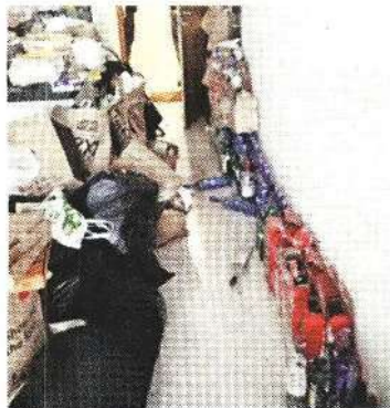
El inmueble estaba desordenado y con hartas botellas de alcohol.

Para determinar las razones de la muerte del sujeto, de 45 años, las autoridades lo trasladaron a un anfiteatro para practicarle una necropsia legal.