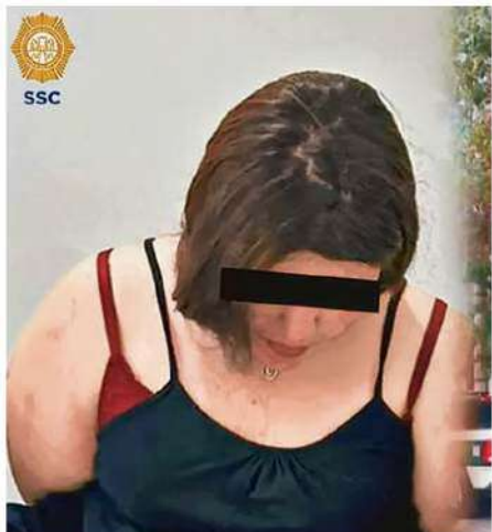
DETENCIÓN. Elementos de la SSC detuvieron a una mujer, sospechosa de matar a otra en un spa.

De acuerdo a los reportes de los vecinos, señalaron que el occiso tenía varios días ingiriendo bebidas alcohólicas, recorrió bares y al percatarse que su departamento estaba abierto llamaron a las autoridades quienes lo encontraron sin signos vitales. /ÁNGEL ORTIZ