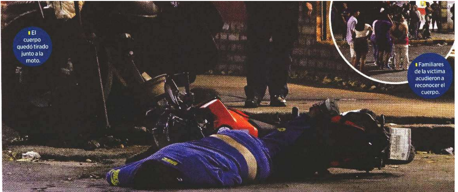
El cuerpo quedó tirado junto a la moto.