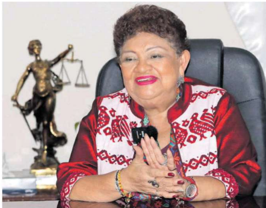
La fiscal detalló que las labores de su dependencia están orientadas con un enfoque diferencial y con perspectiva de género

“La corrupción tiene un impacto social profundo, disminuye la confianza en las instituciones, afecta el desarrollo económico y social, incrementa la inseguridad, genera impunidad y cierra la puerta a la justicia”