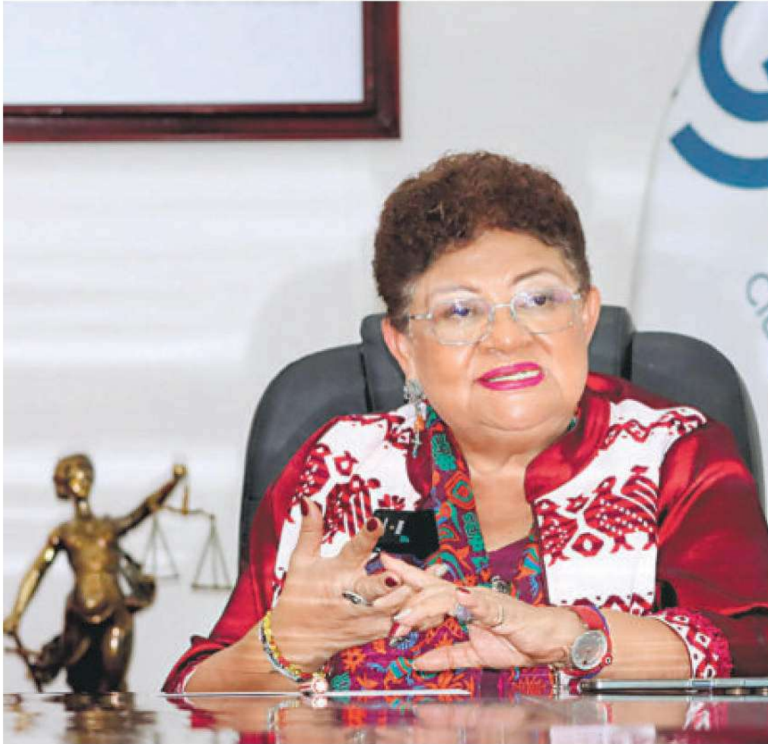
La fiscal debe asistir una vez más al Congreso, luego los diputados votarán para ser ratificada