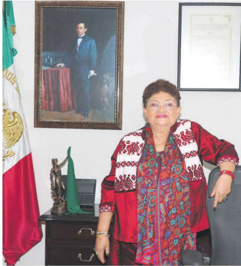
DAVID DECLARTE/ LA PRENSA