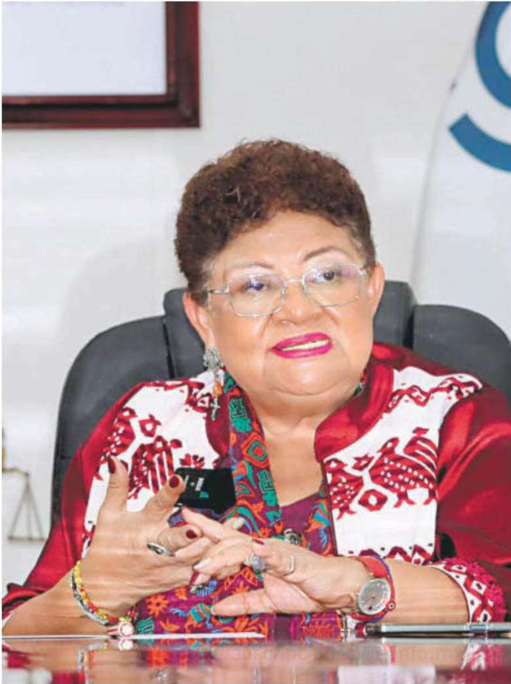
La fiscal debe asistir una vez más al Congreso, luego los diputados votarán para ser ratificada