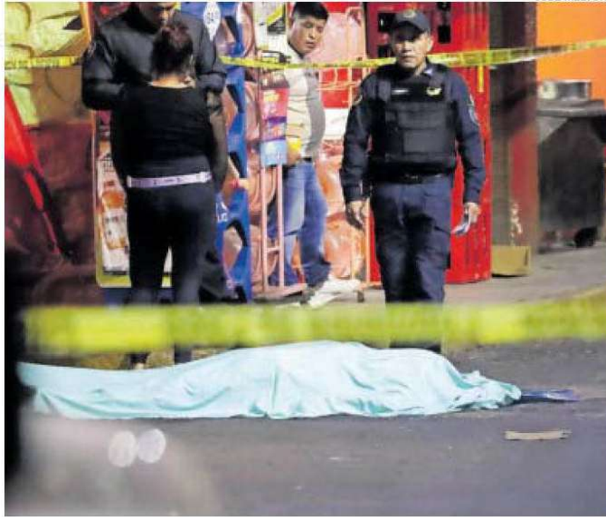
Llevaba la cabeza afeitada, lucía varios tatuajes en los brazos.