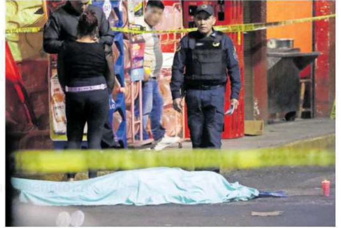
Paramédicos solo pudieron certificar el deceso de dicho individuo, quien yacía sobre un charco de sangre proveniente de las heridas causadas por las balas