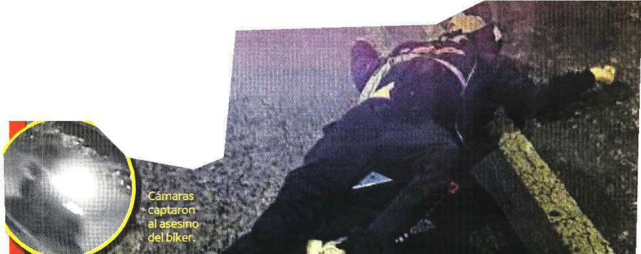
Cámaras captaron al asesino del biker.