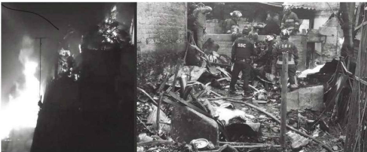
Las llamas arrasaron con todo

Algunos vecinos resultaron intoxicados por el humo, sin embargo, no requirieron traslado al hospital