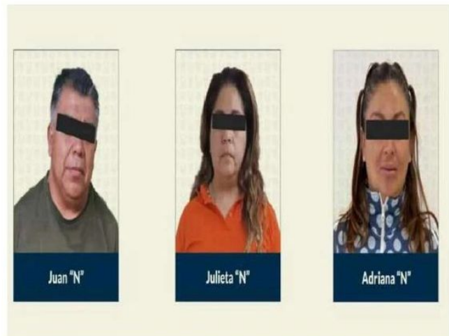
Líderes "Tanzanios" detenidos.