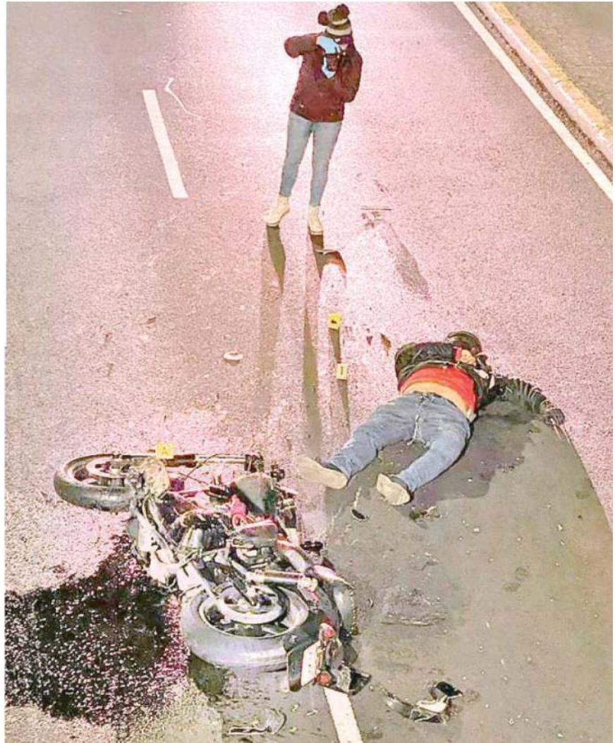
El fatídico accidente ocurrió a las 6:30 de la mañana de ayer