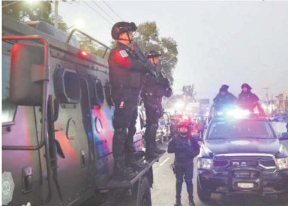
En el operativo desplegarán 607 vehículos de la SSC y la Fiscalía capitalina