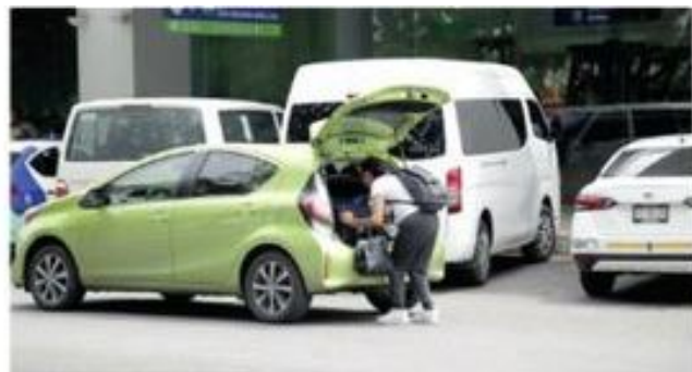
Se ocasionó un daño patrimonial de 120 mdp

En el país más de 280 autos arrendados se utilizaron en homicidios, tráfico de drogas, armas y personas