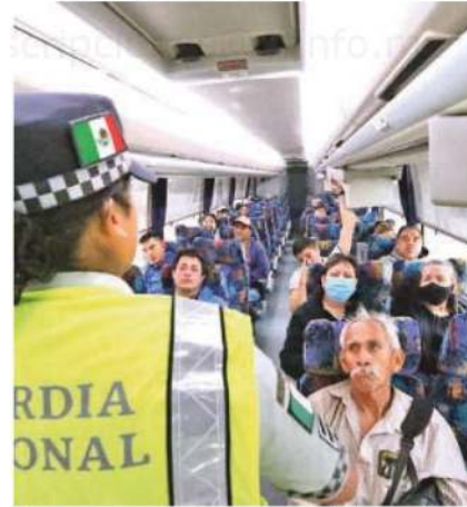
En marcha el "Operativo Paisano"

Ante cualquier incidencia, se recomienda contactar al Centro de Atención Ciudadana, mediante una llamada al 088, o mediante un correo electrónico a la dirección cnac@gn.gob.mx , o a guardia.nacional@gn.gob.mx