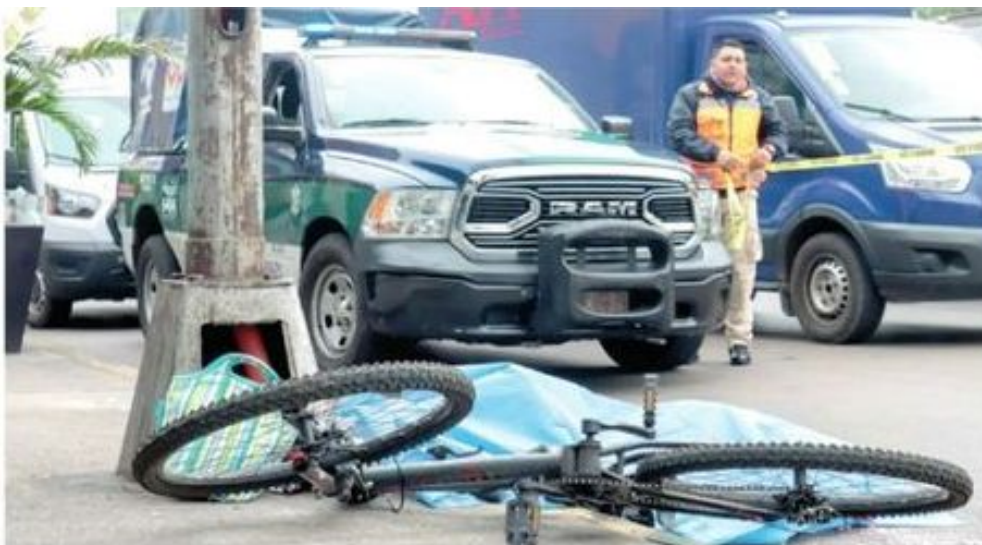
El responsable de atropellar a la ciclista fue detenido

Las redes sociales también funcionan como herramientas de presión social