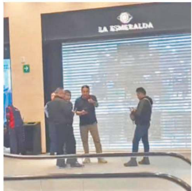
Sujetos robaron en julio una joyería de Plaza Tepeyac