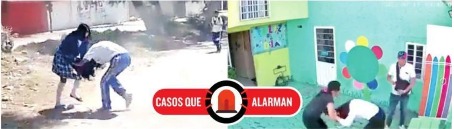
Varios casos han sido resueltos a través de los videos