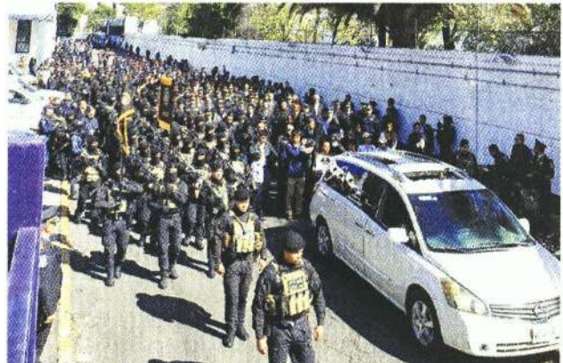
La ceremonia fúnebre se llevó a cabo en instalaciones de la SSC en la Alcaldía Venustiano Carranza.

"Siempre fuimos su prioridad y fue un elemento, para mí, extraordinario, porque siempre estaba al pie del cañón", recordó.