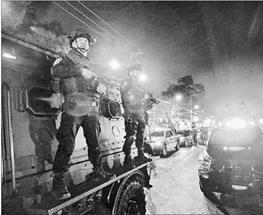
▲ Varias corporaciones participan en las acciones que se complementan con programas sociales.