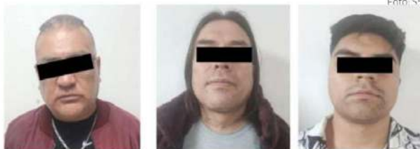
El primer detenido fue detenido y trasladado a un centro penitenciario, sitio en el que fue requerido por un juez para iniciar su proceso legal.

La segunda acción ocurrió en la misma colonia, en la cual se ubicaron a dos hombres de 24 y 42 años de edad que, de igual forma, contaban con una orden de aprehensión vigente, por ese motivo, fueron detenidos y puestos adposición del agente del Ministerio Público.