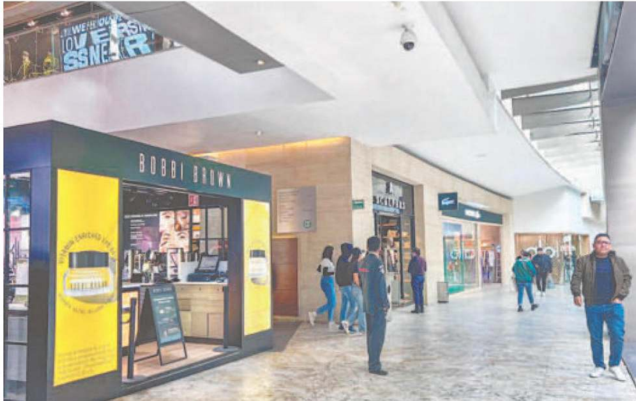
Plazas como Antara reforzaron su vigilancia con apoyo de la SSC