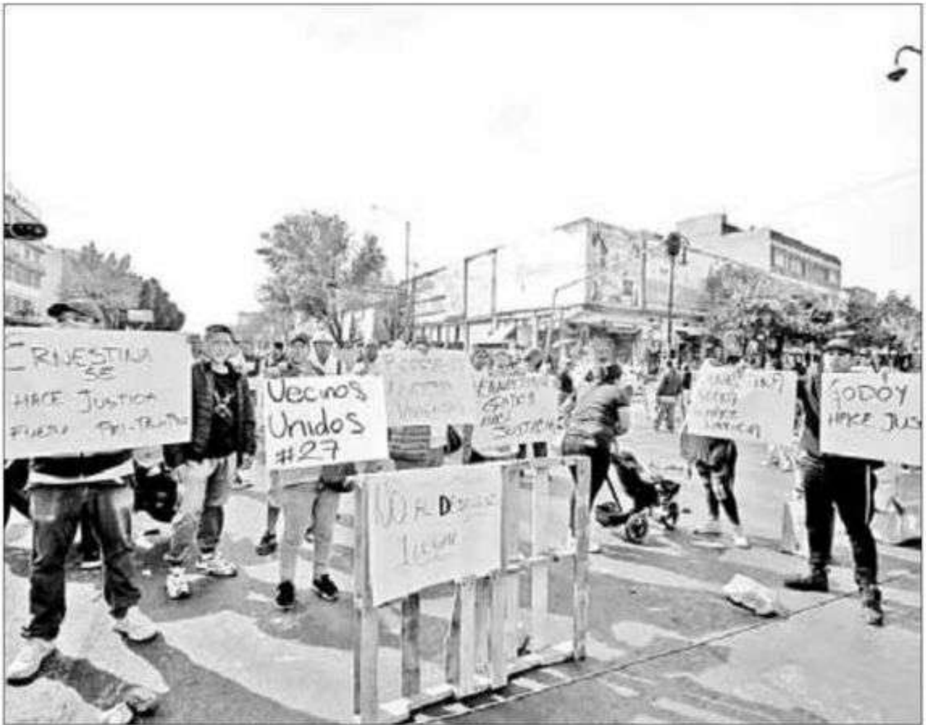
► Habitantes de un inmueble ubicado en la zona de La Merced cerraron avenida Circunvalación, en su cruce con la calle General Anaya, tras ser desalojados.