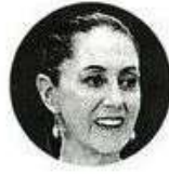
CLAUDIA SHEINBAUM PARDO Precandidata presidencial