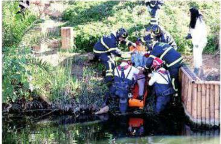
Vecinos exigen más vigilancia en las inmediaciones

El hombre de la tercera edad recordó también que el pasado 12 de noviembre de 2023 otro cadáver fue hallado en la orilla de un canal, a la altura de Calzada de la Viga, en su cruce con avenida Río Churubusco, provocando una gran movilización policiaca.