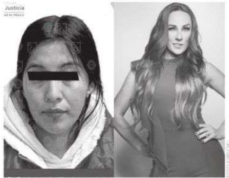
Engañaron a la empleada doméstica