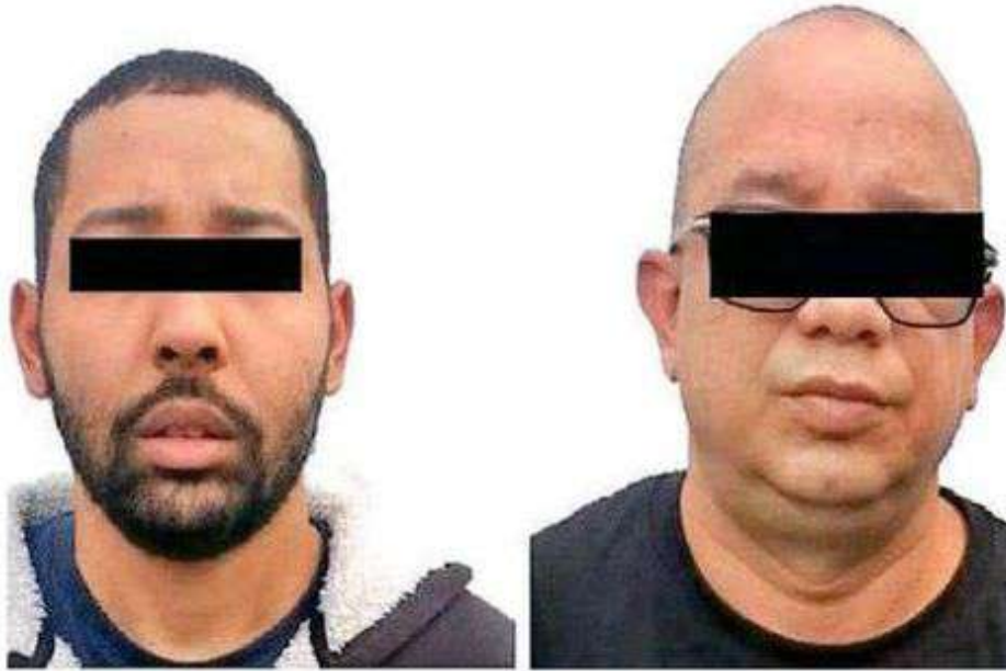
En la alcaldía Cuajimalpa fueron detenidos los dos hombres, junto el automóvil varias dosis de aparente droga y dos teléfonos celulares