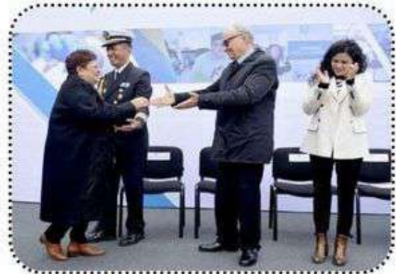
El jefe de Gobierno capitalino, Martí Batres, junto con Ernestina Godoy - Alejandro Gertz la saluda