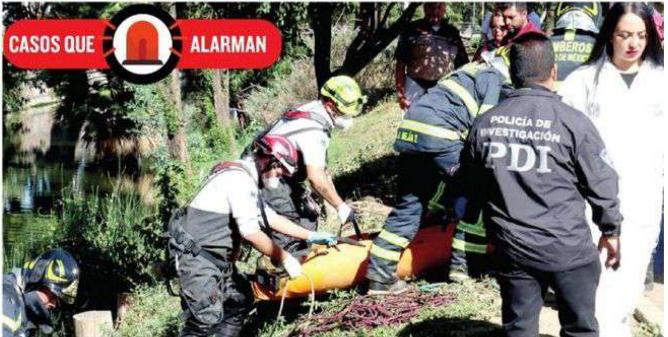
La zona se ha convertido en un panteón clandestino del crimen organizado