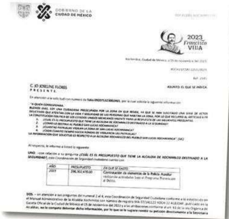
Estrategia fallida de seguridad en Xochimilco