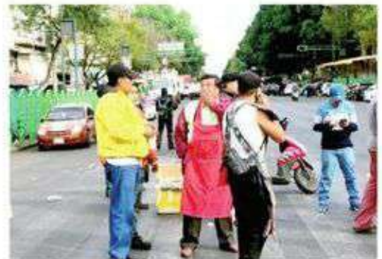
Alegan que inmueble no está en regla

El edificio se mantuvo custodiado por uniformados del equipo táctico antimotines de la policía