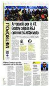
Funcionarios del gobierno federal como el fiscal Alejandro Gertz y la secretaria de Gobernación, Luisa María Alcalde, acompañaron a Ernestina Godoy en su último informe de labores al frente de la FGJ.