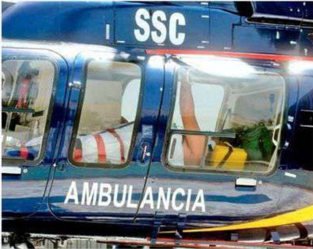
HÉROES. Esta unidad tiene como labor principal la ayuda de pacientes cuya condición es delicada y requieren atención médica inmediata.