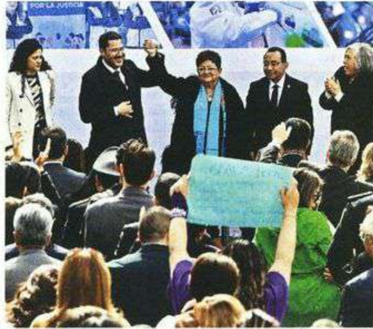
Y al finalizar el evento, el Jefe de Gobierno, Martí Batres, alzó la mano a Ernestina Godoy, un gesto clásico de las campañas.