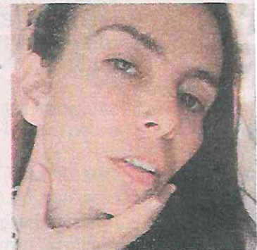
Tiene la última palabra