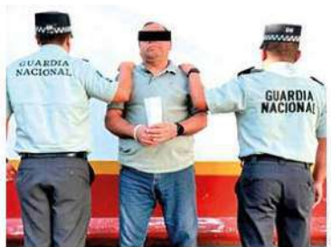
EQUIPO. Derivado de la coordinación interinstitucional, se logró la detención del implicado en Ecatepec.

Tras la detención del presunto implicado, las autoridades le leyeron la Cartilla de Derechos que Asisten a las Personas en Detención, fue ingresado al Registro Nacional de Detenciones, y posteriormente puesto a disposición de la autoridad judicial correspondiente para continuar su proceso legal. / ÁNGEL ORTIZ