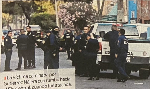
La víctima caminaba por Gutiérrez Nájera con rumbo hacia el Eje Central, cuando fue atacada.