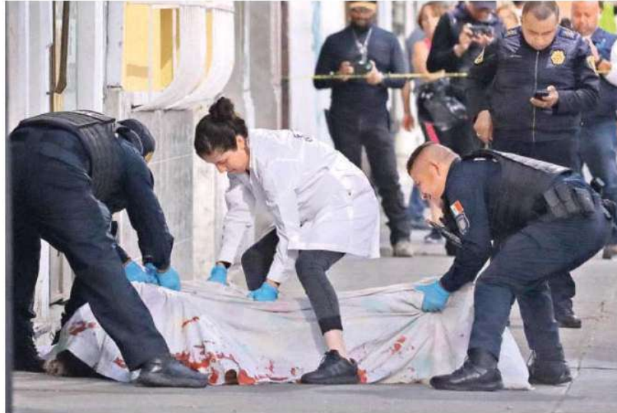
Paramédicos del ERUM, determinaron el fallecimiento del hombre de compleción robusta