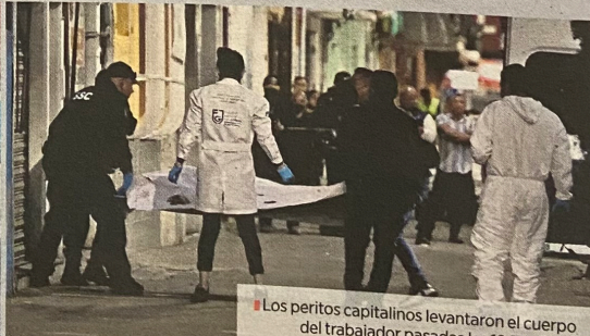
Los peritos capitalinos levantaron el cuerpo del trabajador pasadas las 19:30 horas.