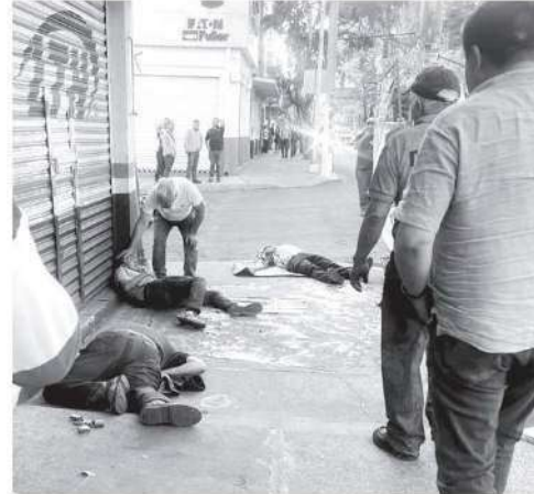
Al parecer se negaron a pagar derecho de piso

Hasta el momento no se reportan personas detenidas relacionadas con los hechos