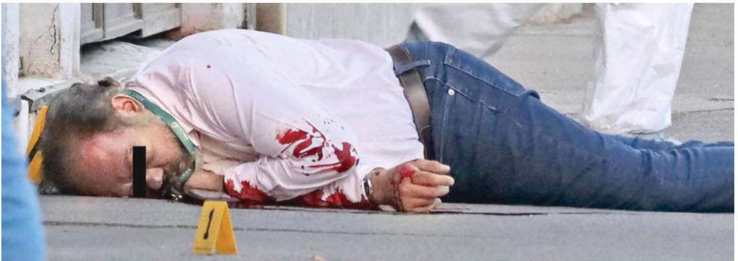
El cuerpo quedó tendido sobre la banqueta, frente a una cortina metálica de color café claro que da acceso a una fonda