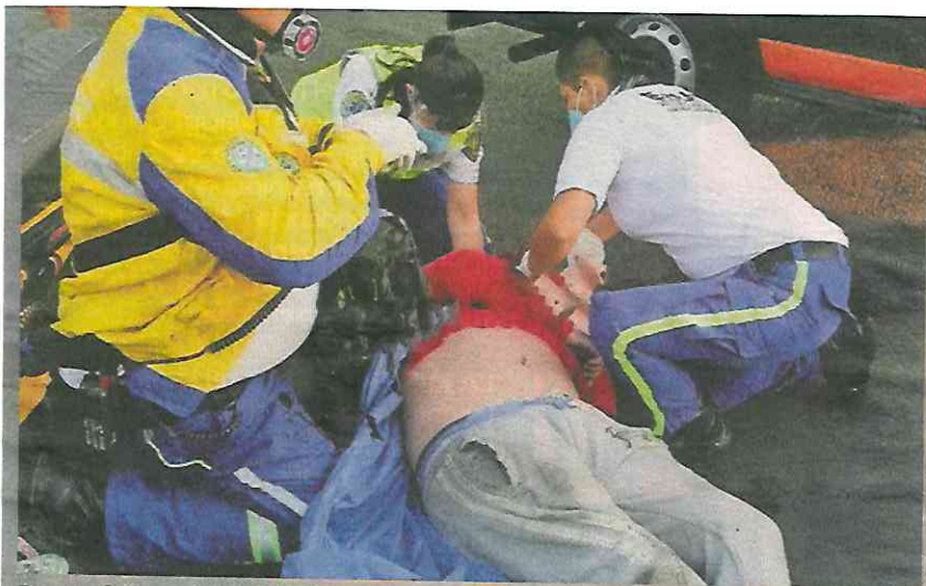
Paramédicos del ERUM dijeron que sufrió fractura de cráneo.