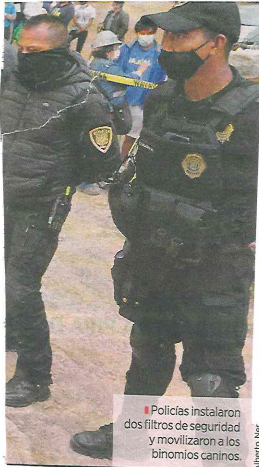
■ Policias instalaron dos filtros de seguridad y movilizaron a los binomios caninos.