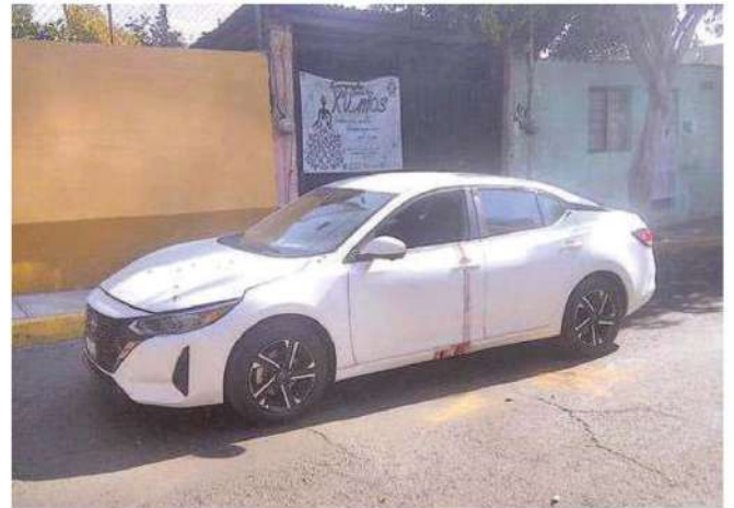
Los homicidas fueron captados por las cámaras de videovigilancia del C2, por lo que siguen siendo buscados por policías de investigación