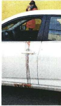
■ En el vehículo se apreciaban los rastros de sangre.