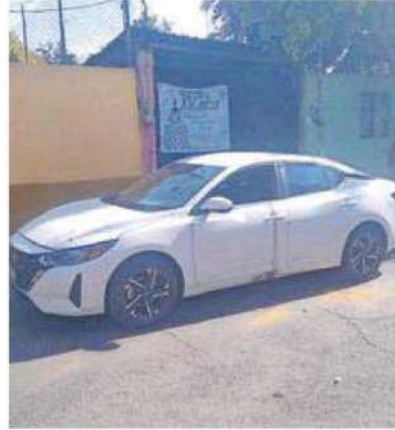
Los balean a bordo de ese auto.