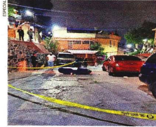
Se indaga un ajuste cuentas como móvil del homicidio.

En el lugar del ataque, las autoridades localizaron un cartucho percutido de calibre 9 milímetros que integraron a la carpeta iniciada por el homicidio.