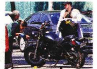
Del total de accidentes de tránsito en los últimos tres meses de 2023, 46% fueron motociclistas.