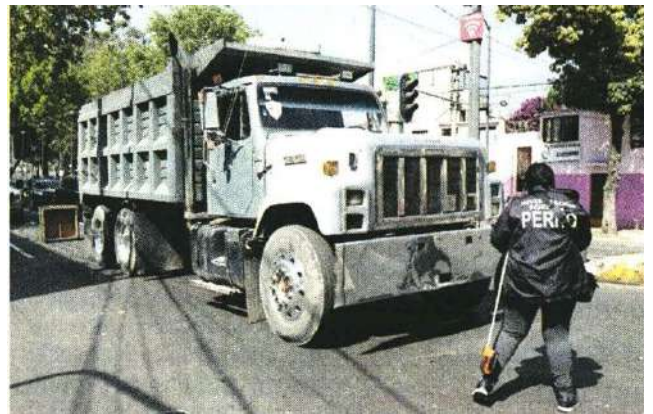
El conductor del camión de volteo afirmó que no se dio cuenta que había atropellado a una persona.

Durante el tiempo que permaneció el cadáver del joven sobre la vía pública no fue reconocido por los transeúntes.