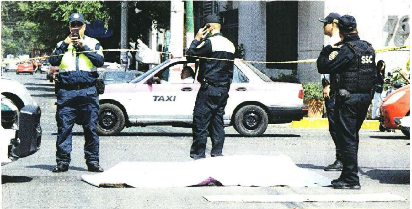
El motociclista fue arrollado en la esquina de Doctor Vértiz y Doctor Márquez; el vehículo de carga lo arrastró 15 metros.