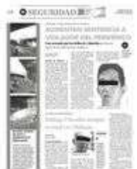
Le partieron su mandarina