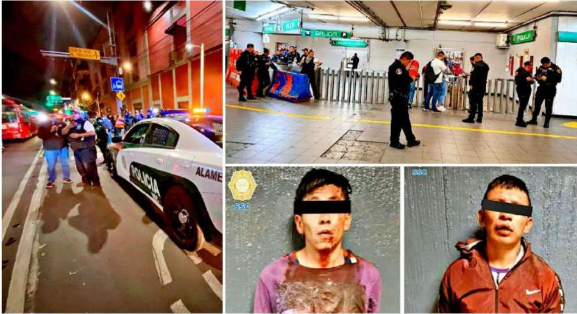
CAPTURA. La Secretaría de Seguridad Ciudadana detuvo a dos presuntos agresores, quienes balearon a una mujer el domingo por la noche en Bellas Artes.