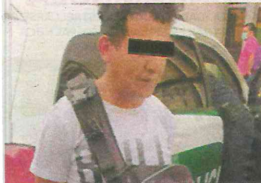
Ahora duerme en las instalaciones del MP

Al notar que la unidad policial se acercaba, el hombre comenzó a caminar más rápido pero le dieron alcance a la altura de la avenida Hidalgo.