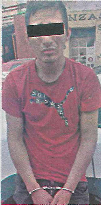
Señalado como presunto asesino

En el sitio, los efectivos tuvieron contacto con un hombre que se encontraba recostado en el piso, con visibles manchas hemáticas en la cabeza, por lo