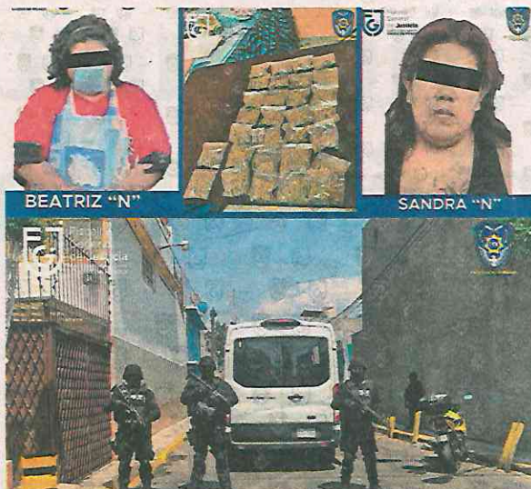
Había gran surtido de estupefacientes y armas de varios tipos

A las personas mencionadas en este comunicado se les presume inocentes hasta que no concluya el proceso.