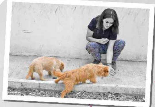
• La directora de la Brigada da atención a todos los canes que tienen resguardados.

1 La Brigada se encarga de la rehabilitación de animales.