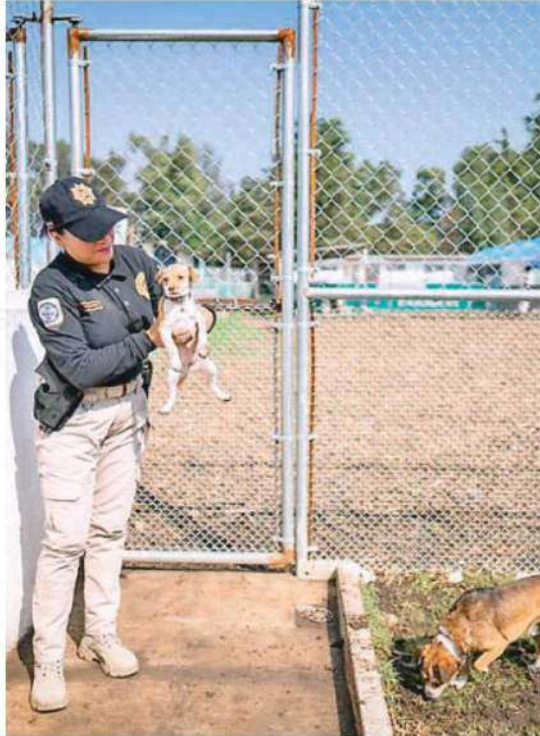
En ese lugar tendrán la vida digna que merecen todas las especies