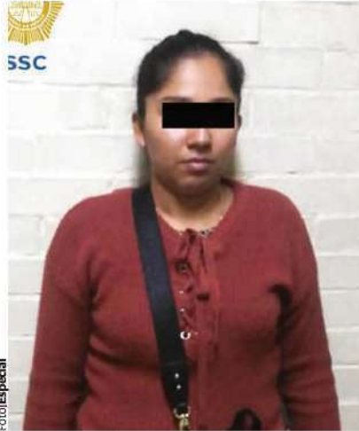
LA MUJER que transportaba el dinero, tras su detención por parte de elementos de la Policía Auxiliar, ayer.