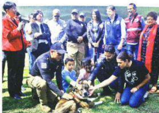
La socialización dentro espacio será clave para rehabilitar.