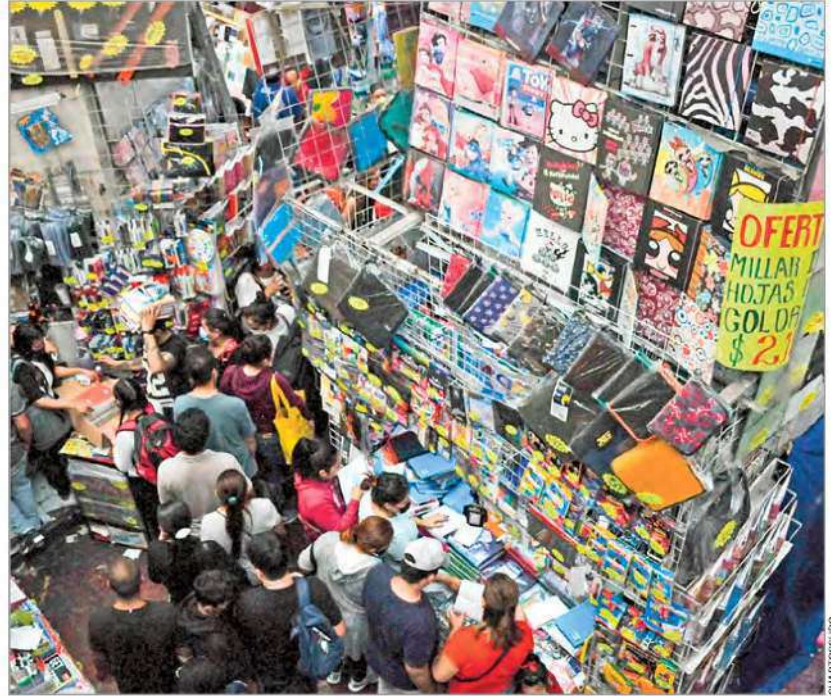
OPERATIVO. El operativo arranca hoy y culmina el 10 de septiembre, principalmente en las calles de República de Uruguay, República del Salvador, Mesones y Regina.