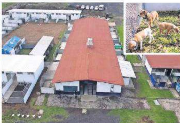
La Ciudad de los Perros y los Gatos, un lugar donde sus inquilinos serán altamente cuidados y atendidos, pues cada uno de los que llegue merece una vida de atención y respeto, indicaron autoridades.

Es un área especial localizada dentro de la Brigada de Vigilancia Animal para que mascotas se recuperen