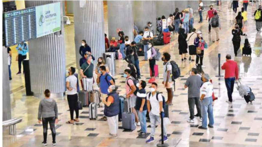
Proponen darle hasta 15 años de cárcel a quienes oferten servicios turísticos "fantasma" y hayan cobrado el dinero por ello