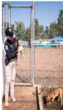
La Brigada de Vigilancia Animal ha rescatado a 139 especies en lo que va del año.

"El avance del animalismo en México significa un progreso en