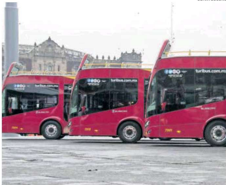
El transporte turístico de la ciudad está listo para recibir a los visitantes.