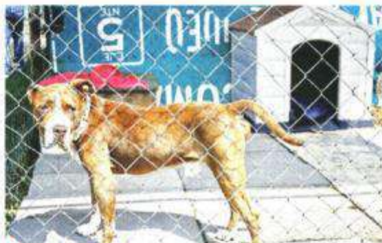
El Centro de Rehabilitación Animal de Cuautla será ejemplo.