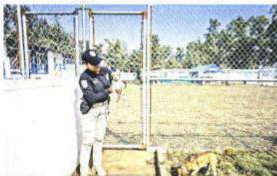
Los perros y felinos llegan a este lugar tras padecer maltrato.

"Podrán rehabilitarse físicamente, pero también emocionalmente para volver a un nuevo hogar", señaló.