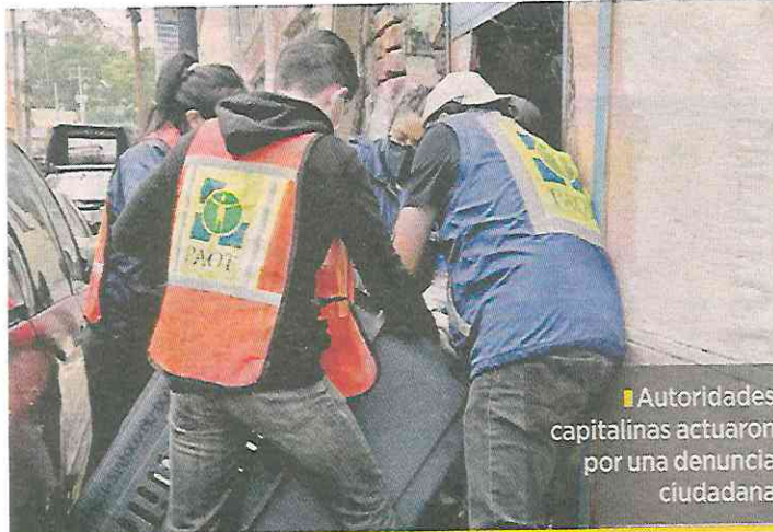
■ Autoridades capitalinas actuaron por una denuncia ciudadana.