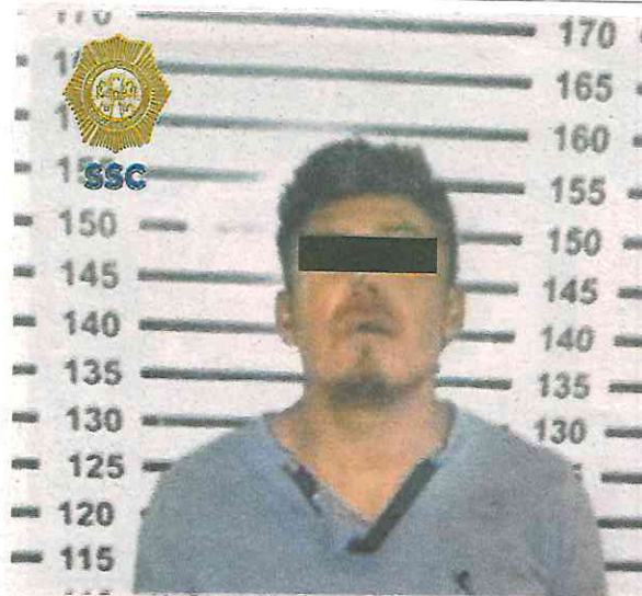
Al hombre le aseguraron un cuchillo de casi 15 centímetros de largo

En tanto, el hombre de 37 años de edad fue detenido y de acuerdo al protocolo de actuación policial, se le efectuó una revisión preventiva, tras la cual se le aseguró un cuchillo de aproximadamente 15 centímetros de largo; después, fue presentado junto con el arma punzocortante, ante el agente del Ministerio Público correspondiente, quien integrará la carpeta de investigación y determinará su situación legal.