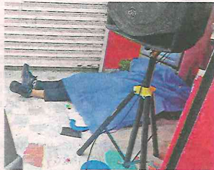
Francisco "N" fue asesinado de un balazo frente a su hija y un amigo

Decenas de agentes de la Secretaría de Seguridad Ciudadana de la Ciudad de México intervinieron y resguardaron la zona para evitar que los indicios fueran alterados o eliminados.