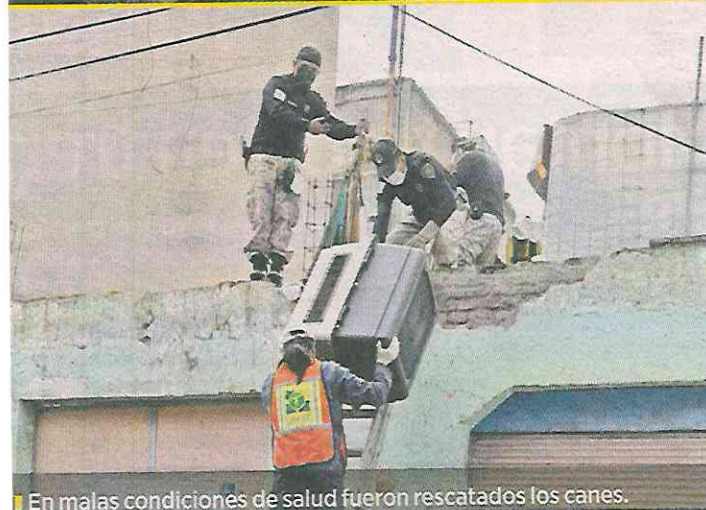
■ En malas condiciones de salud fueron rescatados los canes.