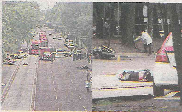
El encontronazo fue terrible

El impacto le hizo perder el control de la moto, por lo que el