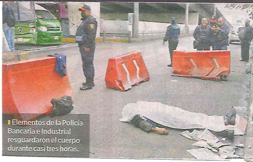
■ Elementos de la Policía Bancaria e Industrial resguardaron el cuerpo durante casi tres horas.

Algunas personas que venden alimentos en el sitio reconocieron al señor, pero no pudieron identificarlo formalmente.