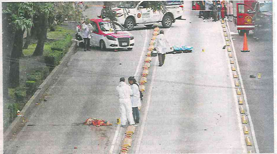
Un motociclista mata a viejita y muere tras chocar contra taxi

El delgado piloto intentó controlar el volante de la pesada motocicleta, aparentemente cilindrada 600, pero se topó con