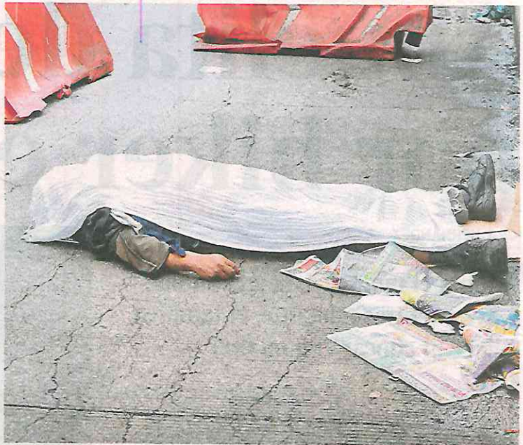
El cuerpo permaneció bocarriba y cubierto con una manta blanca

Los paramédicos llegaron buscando reanimar sin éxito al hombre, ante la mirada de chóferes del Trolebús y ven-