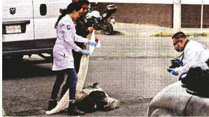
■ Un hombre en situación de calle falleció en la Colonia Morelos.

Una hora después, personal de Servicios Periciales realizó sus diligencias y levantó el cuerpo del hombre, quien fue llevado al anfiteatro como desconocido.