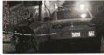
Encuentra la muerte en una bamba