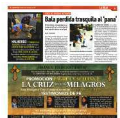
El lesionado fue atendido en la herida.