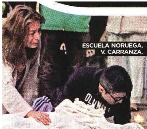
ESCUELA NORUEGA, V. CARRANZA.

HIZO EL TRABAJO SUCIO CAE CONSERJE DE PRIMARIA Y MUERE AL AHUYENTAR A RATAS SEGURIDAD 4