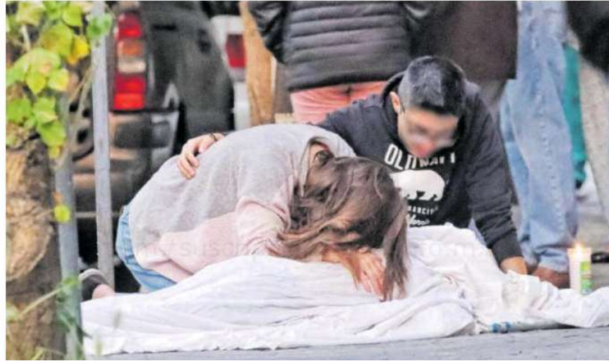
Las heridas que sufrió al momento de estrellarse su cuerpo contra el asfalto le arrebataron la vida