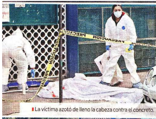
La víctima azotó de lleno la cabeza contra el concreto.