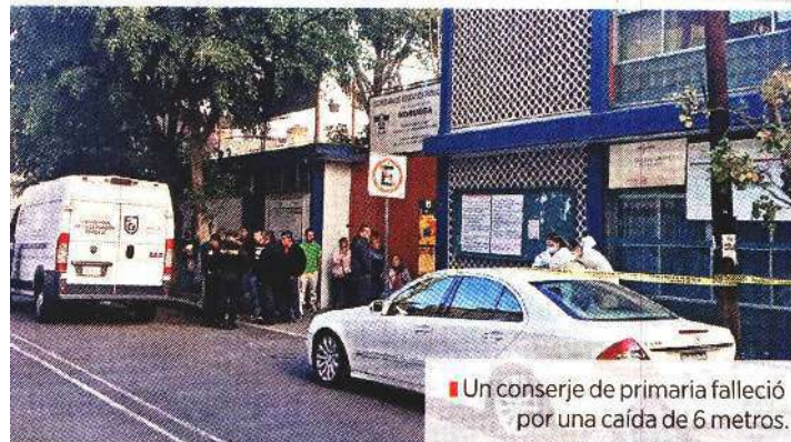
Un conserje de primaria falleció por una caída de 6 metros.