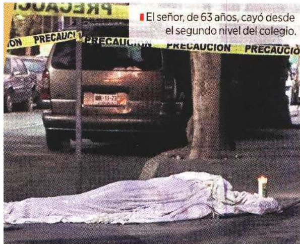
El señor, de 63 años, cayó desde el segundo nivel del colegio.