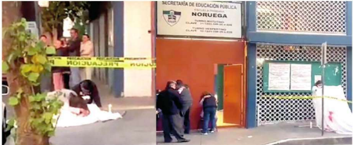
El intento de robo ocurrió durante la madrugada