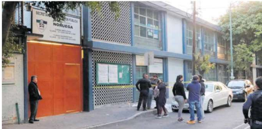
Los hechos ocurrieron en la Escuela Primaria Noruega, ubicada en las inmediaciones de la Colonia Jardín Balbuena, en la alcaldía Venustiano Carranza