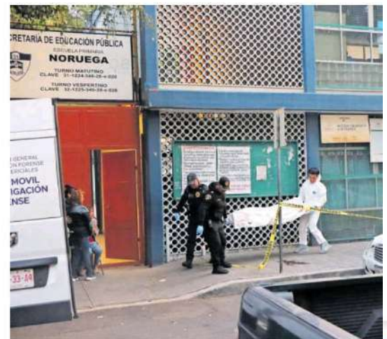
La víctima quedó tendido en el asfalto inconsciente, donde comenzó a desangrarse a unos cuantos metros de la entrada de la escuela