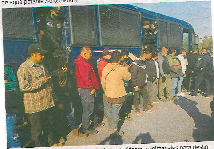
Los detenidos fueron remitidos ante las autoridades ministeriales para destinar responsabilidades