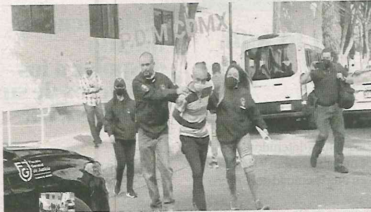
Ya duerme en el Reclusorio Oriente

El depravado fue asegurado luego de varias denuncias y trabajos de investigación realizados por la Policía Cibernética de la Fiscalía capitalina, quienes lograron establecer que Marco "N" utilizaba una