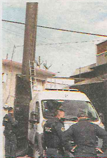
Cayó dentro de un predio

Las autoridades indagan si el hoy occiso trabajaba bajo las medidas de seguridad establecidas