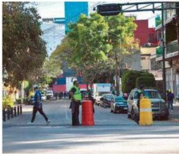
Autoridades capitalinas también cierran las vialidades