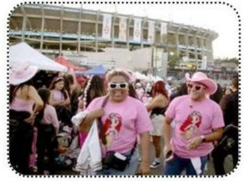
Organizaciones delictivas perpetraron cientos de robos de teléfonos celulares, carteras, prendas de vestir originales, venta de boletos falsos