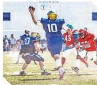
Los Tigres de Bengala no tuvieron oportunidad ante el poderío rival.