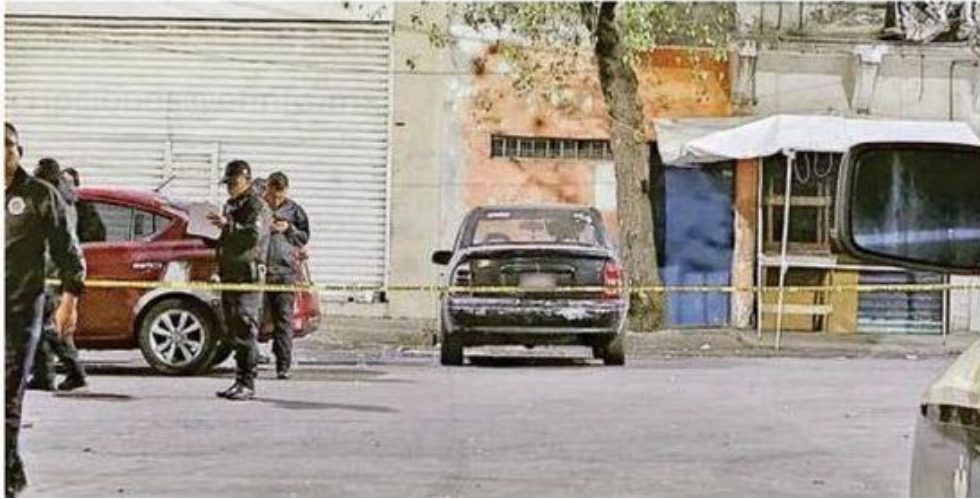
La pareja se encontraba al interior de un automóvil particular, mismo que estaba estacionado