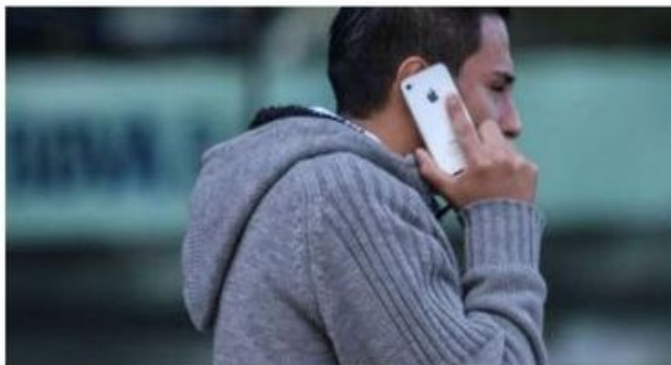
Al activar el Botón de Auxilio, la alerta llega directamente al C2 más cercano a la ubicación del solicitante.