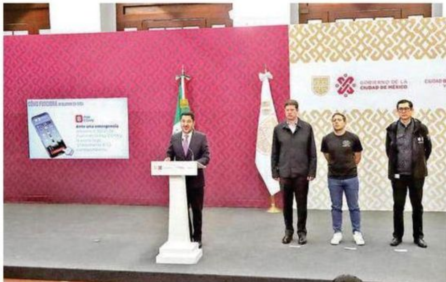
Martí Batres, jefe de Gobierno capitalino, explicó que si una persona se encuentra en situación de peligro puede activar la alarma y personal de C2 enviará el apoyo necesario

MIL POSTES vecinales conectados al C5 se han instalado desde el inicio de esta administración