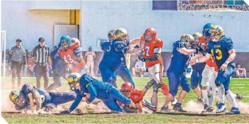
Las jugadas fuertes estuvieron a la orden del día, pero bajo un ambiente netamente deportivo.