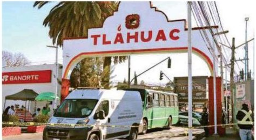
La mujer quedó inerte sobre un charco de sangre proveniente de la cabeza; el chofer fue detenido

Posteriormente, integrantes del área pericial y Forense de la Fiscalía capitalina, se presentaron en el sitio y tras recabar los indicios necesarios para esclarecer los hechos, procedieron a realizar el levantamiento del cadáver.