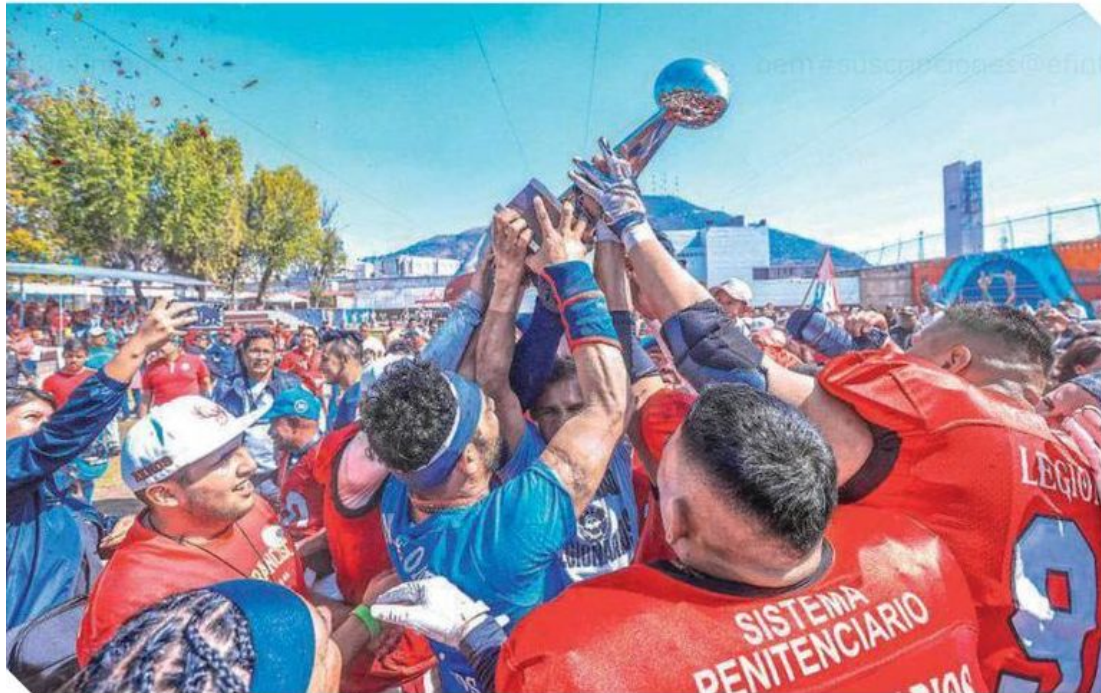
Jugadores de los Legionarios levantan el trofeo que los acredita vencedores de este Tazón.