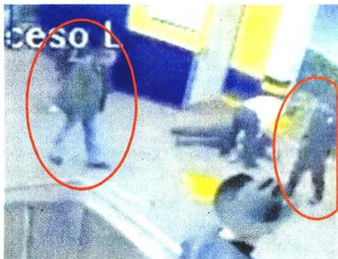
En las imágenes del día del homicidio se observa a El Chiquilín y a un policía del Cusaem, mientras la víctima se encuentra en el piso.

"Se va a seguir la investigación y se llevarán a cabo otras órdenes de aprehensión y en su momento se cumplimentarán..."