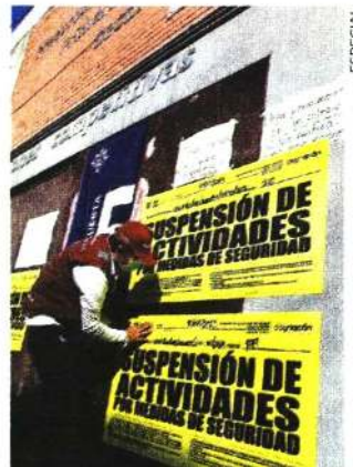
Sellos de suspensión de actividades fueron puestos en el colegio.

Ayer, la alcaldía Coyoacán colocó sellos de suspensión de actividades como medida cautelar en el colegio. Deberá acreditar su legal funcionamiento, y medidas en materia de Protección Civil. ●