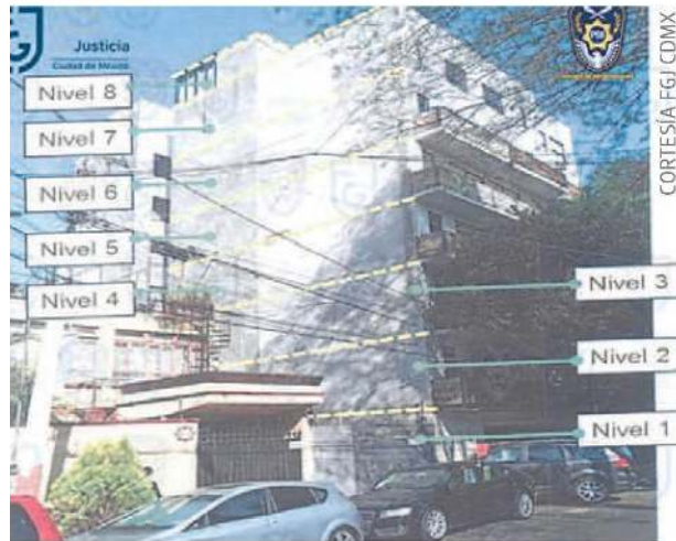
El edificio tiene cinco pisos irregulares