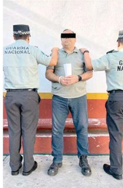
Al hombre, de 57 años de edad, le fue leída la Cartilla de Derechos

La Guardia Nacional refrenda el compromiso de sumar sus capacidades operativas con instituciones de los tres órdenes de gobierno, para garantizar la paz y seguridad de las y los mexicanos.