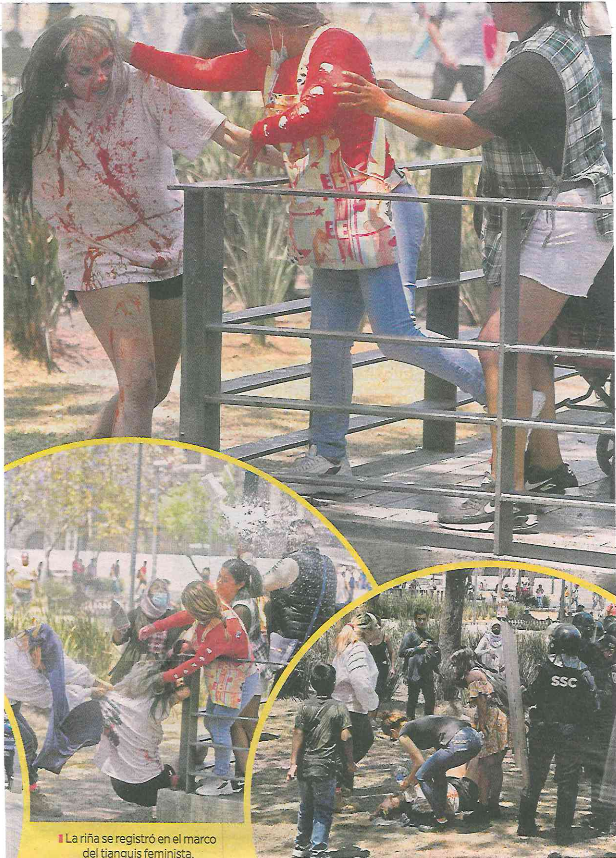
■ La riña se registró en el marco del tianguis feminista.