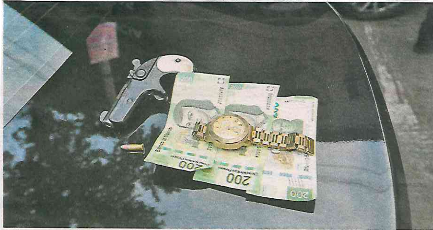
Operadores del CS implementaron un cerco virtual para evitar que se dieran a la fuga