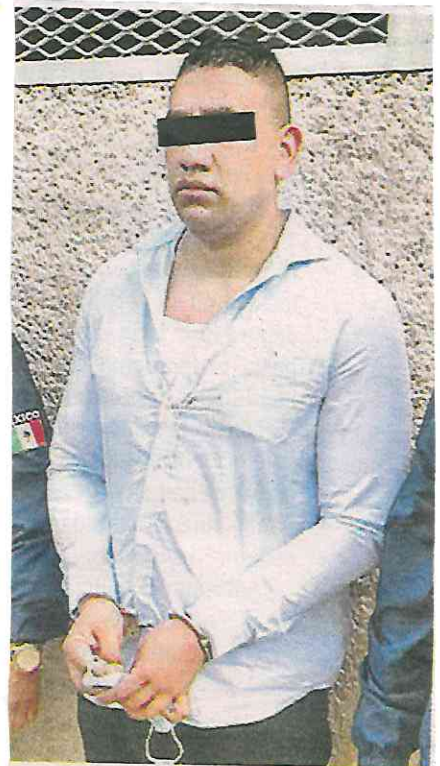
Las víctimas dieron la media filiación de los implicados, así como el modus operandi

En medio de un fuerte dispositivo de seguridad, Arturo "N" fue llevado a la Fiscalía de Investigación Estratégica Central, en la colonia Doctores, para determinar su situación jurídica.