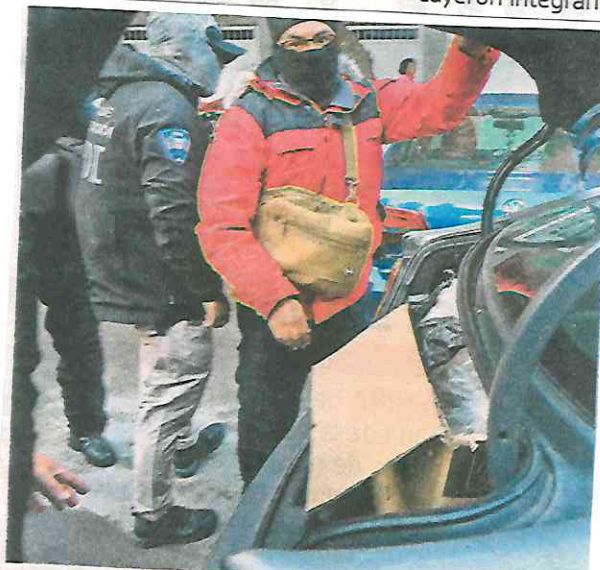
Esta vez también detuvieron a otro par en custodia de estupefacientes