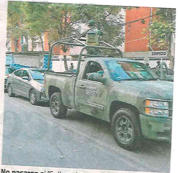
No pasaron ni 15 días y hubo otro operativo, esa vez cayeron integrantes de Los Gallos