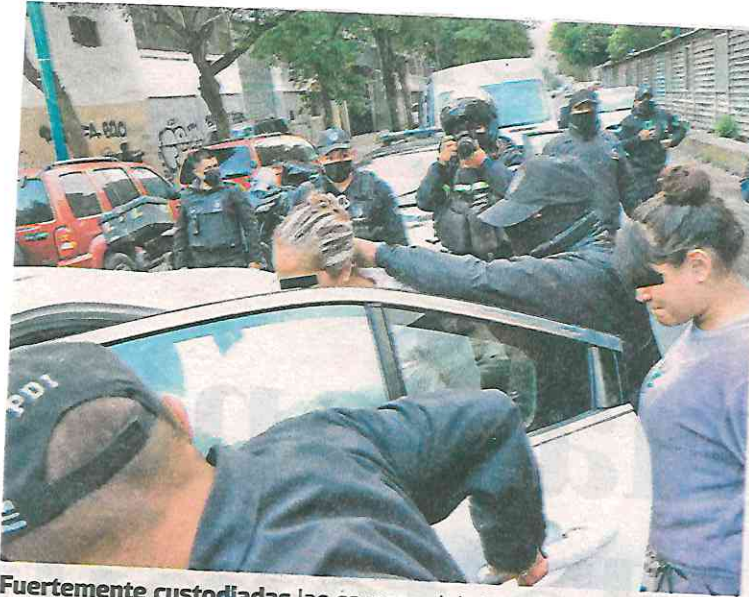
Fuertemente custodiadas las sacaron del domicilio, que fue sellado para su investigación complementaria