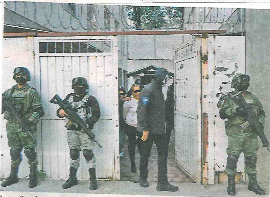
Investigaciones antinarco llevaron a presentarse por segunda ocasión al fraccionamiento

Recordemos que el 27 de mayo del presente año, en esa misma zona, pero en el edificio "B", se realizó un operativo para desarticular un punto de venta de droga, donde también se detuvieron a dos personas, porque se encontraban en posesión de droga y armas de fuego; se presume que son integrantes de la banda de "Los Gallos".