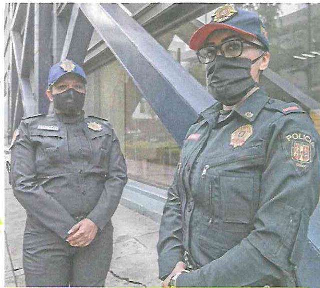
GERMÁN ESPINOSA. EL UNIVERSAL

Uniformados de la Policía Auxiliar (PA), la Policía Bancaria e Industrial (PBI) y personal de Sector de la Secretaría de Seguridad Ciudadana (SSC) han brindado auxilio a mujeres que