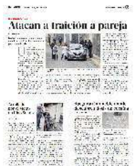
Una pareja fue baleada en el interior de este auto en calles de la Colonia San Pedro Mártir