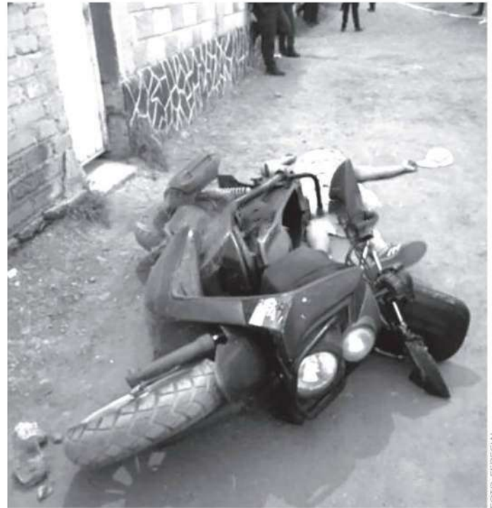
Al parecer le cobraron una afrenta

en la colonia Del Mar Norte. La policía no logró detener a los homicidas, quienes huyeron con dirección hacia el Estado de México.