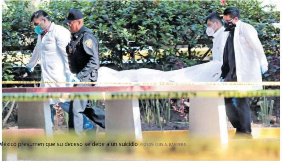
Los investigadores de la Fiscalía General de Justicia de la Ciudad de México presumen que su deceso se debe a un suicidio