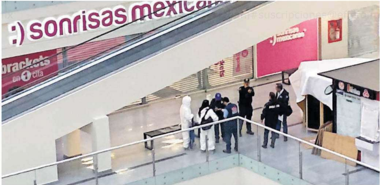
El centro comercial Town Center el Rosario fue el escenario de este terrible hecho; se desconoce si se trató de un accidente o fue premeditado