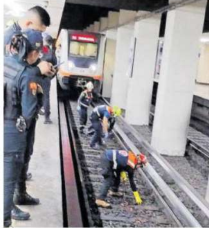
Un hombre murió al arrojarse al paso de un convoy del Metro en la estación Pino Suárez