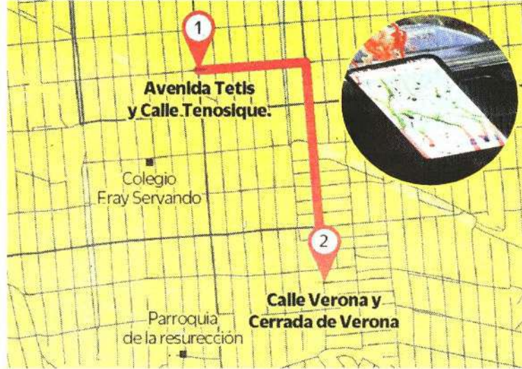
Esa es la distancia entre el punto donde estaría la usuaria y donde murió el chofer.