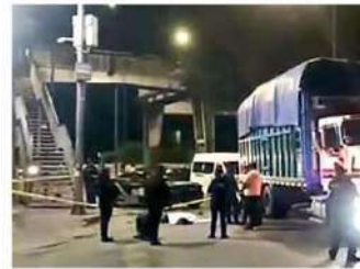
Falleció al instante

La víctima no fue identificada, pero al momento de su deceso vestía pantalón negro, camisa de color rojo y chaleco negro.