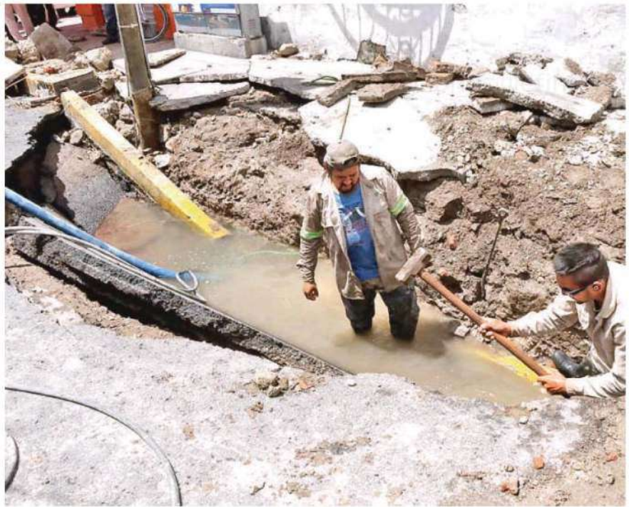
La llamada de emergencia fue atendida inmediatamente y trabajadores repararon la enorme fuga

Luego de varias horas de ardua labor por parte de los cuerpos de emergencia lograron sacar el agua de las calles y se hará el recuento de los daños para auxiliar a las familias afectada.