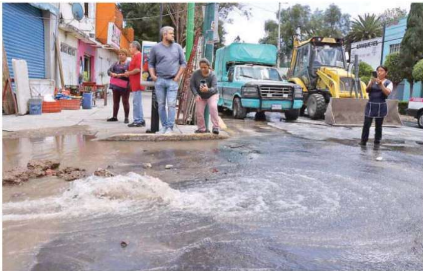
Enorme fue la cantidad de agua potable que escapó por la tubería dañada en calles de la Colonia Martín Carrera