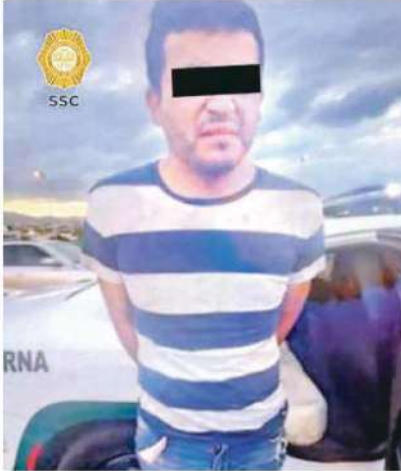
El imputado fue aprehendido horas después del crimen