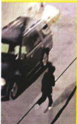
El delincuente escapa y sube a un vehículo gris, que fue asegurado.