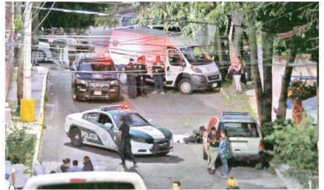
Familiares exigen justicia y todo el peso de la Ley para el detenido, además pidieron se detenga a otros implicados en la riña en la que falleció su familiar