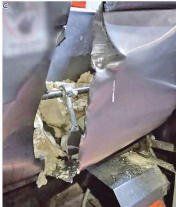
El joven permanecía con el brazo derecho atrapado en la charola amasadora