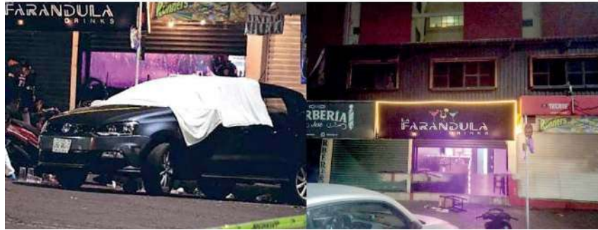
La policía ya busca a los demás participantes en la mortal reyerta