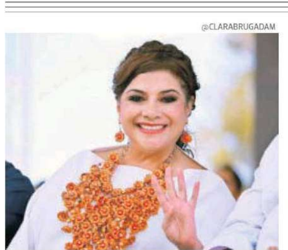
Dice que deja la alcaldía en una mejor condición a como la recibió.