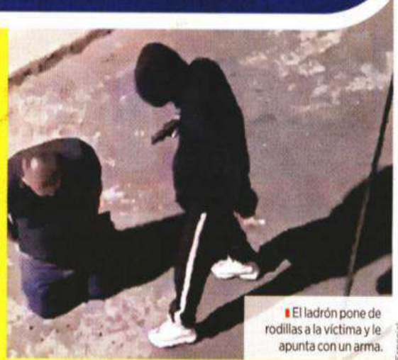
El ladrón pone de rodillas a la víctima y le apunta con un arma.

Al sospechoso le aseguraron bolsas con posible marihuana y también un vehículo color gris en el que huyó.