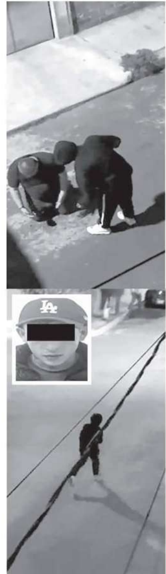
Así operan los delincuentes

El responsable del violento atraco ya fue capturado