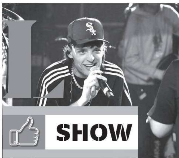
● Doble P cerró el festival con un gran éxito