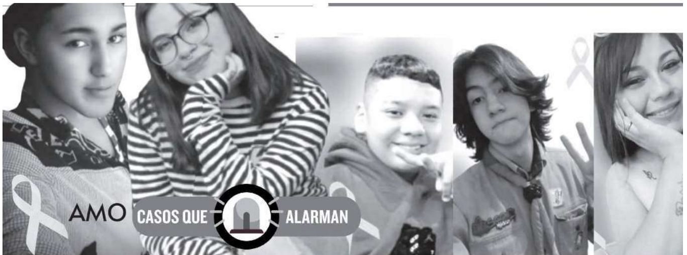
Algunos sobrevivientes dan sus testimonios