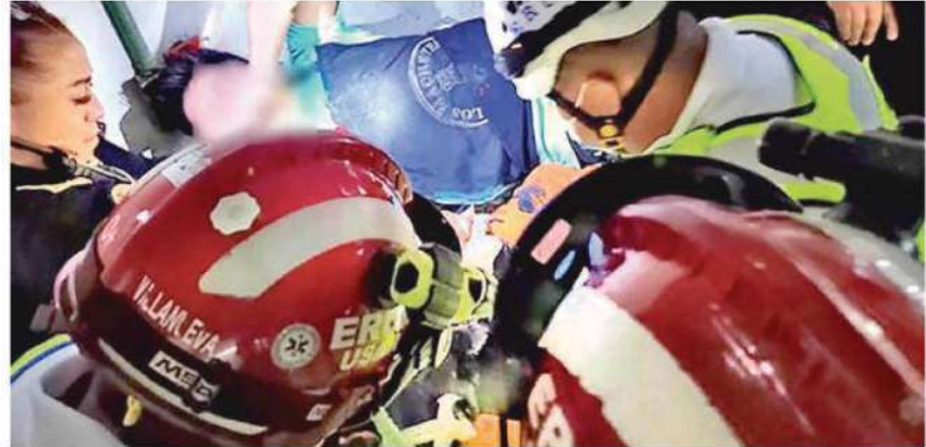
Personal del ERUM arribó de inmediato al punto para iniciar las maniobras adecuadas para el salvamento

Fue valorado por paramédicos quienes lo diagnosticaron con posible fractura de articulación radio cubital