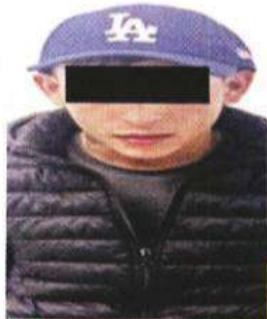
El sospechoso de 18 años fue detenido en la Colonia Los Ángeles.