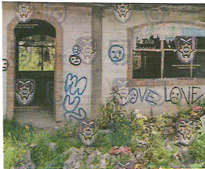
Predio La Negra, ubicado en Tlalmanalco, Edomex.

El vocero de la fiscalía general también dio a conocer extinciones de dominio de tres inmuebles, en los que grupos delictivos almacenaban y comercializaban diversas drogas, ubicados en colonias de las alcaldías Gustavo A. Madero e Iztacalco.