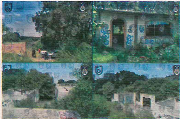
En mayo de 2013, uno de los grupos delictivos que operan en Tepito raptó a 13 jóvenes que vivían en el barrio bravo y los ejecutó en un inmueble de Tlalmanalco.

La Fiscalía General de Justicia de la Ciudad de México (FGJCD-MX) logró la extinción de dominio del rancho 'La Negra', ubicado en Tlalmanalco, Estado de México, a nueve años del plagio, tortura y asesinato de los 13 jóvenes originarios del barrio bravo de Tepito que fueron plagiados del bar Heaven de la Zona Rosa y luego llevados a este in-