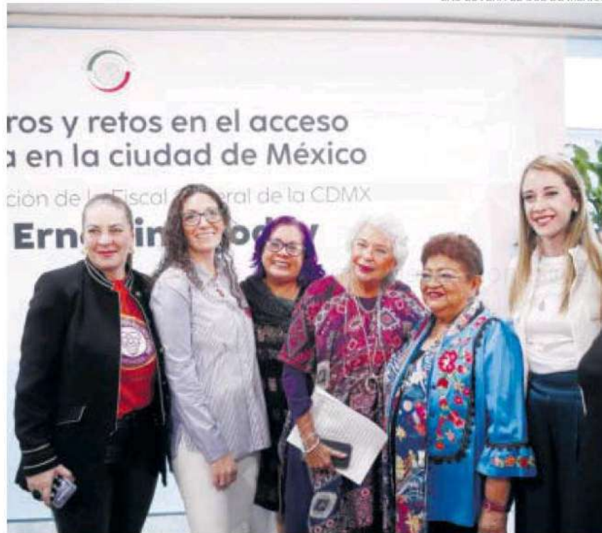
La ciudadanía asegura que Ernestina Godoy ha politizado la justicia.