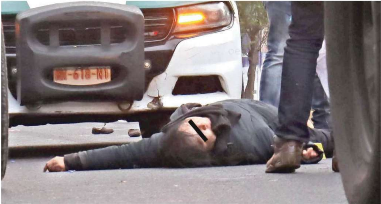
La mujer trato de cruzar la Avenida Ferrocarril de Cintura en su esquina con calle Victoria