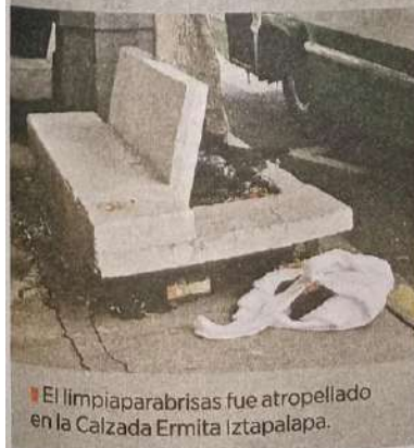
El limpiaparabrisas fue atropellado en la Calzada Ermita Iztapalapa.

Una familiar de la víctima llegó cuando el cuerpo ya había sido levantado y sólo se llevó el detergente y los limpiadores que usaba para realizar su trabajo.