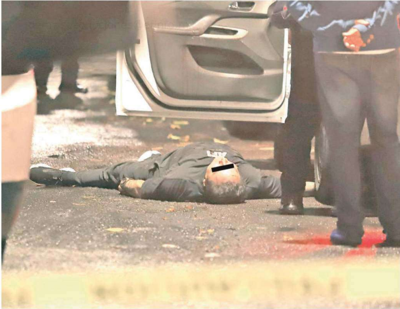
A un costado de su auto quedó el cadáver de un hombre que fue asesinado por solitario criminal en calles de la Colonia Moctezuma