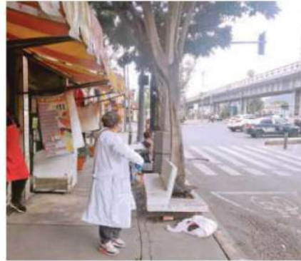
Un limpiaparabrisas fue atropellado y muerto por un autobús de transporte público /LUIS BARRERA

Ahí, en el sitio del accidente quedó el charco de sangre y sus pertenencias que luego fueron levantadas por sus conocidos.