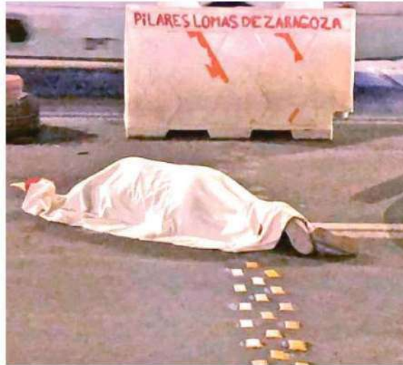
El chófer sin dudarlo la arrolló pasando los neumáticos sobre el cuerpo de la mujer /JOSE MELTON