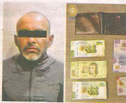
El hombre cuenta con cinco ingresos al Sistema Penitenciario de la Ciudad de México

Con el apoyo de las cámaras de seguridad se implementó un cerco virtual y con las características físicas proporcionadas por el denunciante, se localizó al posible implicado, un hombre de 42