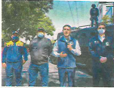
El jefe policiaco, Omar García Harfuch, supervisa el operativo a favor de peregrinos