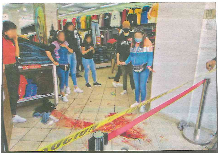
EN SANGRIENTA AGRESIÓN DENTRO DE LOCAL DE IZAZAGA, UN JOVEN RESULTÓ HERIDO DE BALA Pág. 12