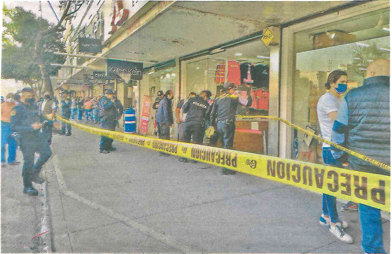
Muy cerca del Metro Pino Suárez, se escuchó un disparo que alertó a las autoridades