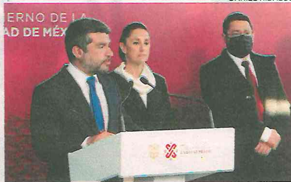
Claudia Sheinbaum se reunió con el alcalde Tabe

Durante la instalación del Gabinete de Seguridad y Mesa de Construcción de Paz en esa demarcación, los dos funcionarios plantearon la rehabilitación de al menos 30 módulos para ser ocupados por la Policía Auxiliar y con eso dar respuesta a una demanda vecinal, con el propósito de recuperar esos espacios.