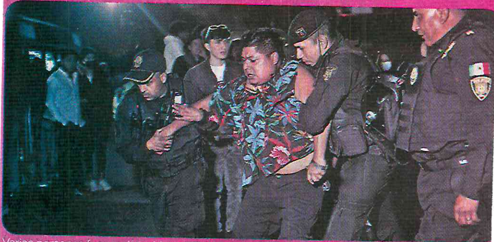
Varias personas fueron detenidas por ofrecer boletos en reventa.