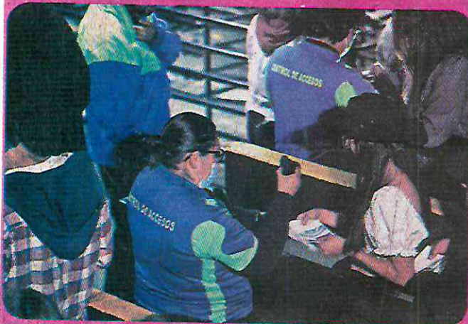
La revisión de los boletos de ingreso se hizo de una forma más controlada, aunque sí hubo muchos rechazados.