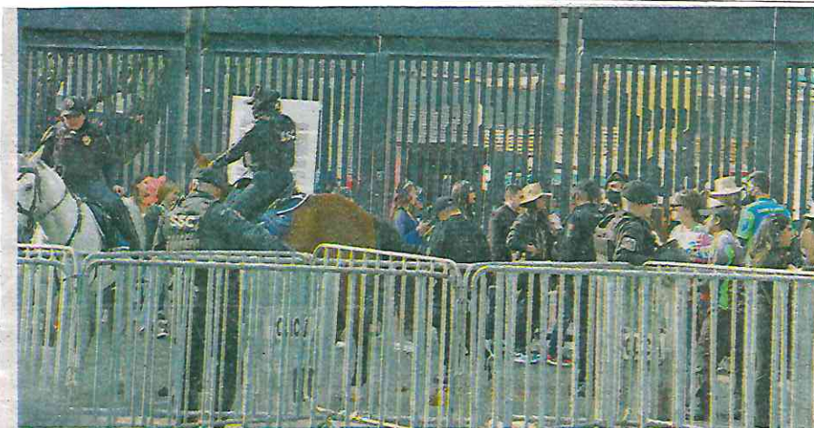
La SSC de la CDMX y Profeco despliegan operativo en el Azteca por el segundo concierto de Bad Bunny

Varios de los fanáticos del cantante puertorriqueño, algunos provenientes de diferentes estados de la República, dijeron