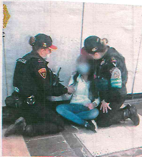
Las mujeres policías atienden a usuaria del STC Metro que intentaba lanzarse a las vías

Arribó un psicólogo del programa "Salvemos Vidas", quien entabló una charla con ella, la calmó y tras valorarla, la diagnosticó con crisis de ansiedad