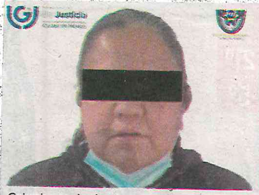
Cobraba por los hampones

La Policía de Investigación (PDI) busca a los cómplices de la mujer detenida