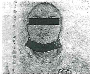
Le espera larga condena

Al llegar al templo, los policías vieron que un grupo de vecinos tenía retenida a Luna "R", de 32