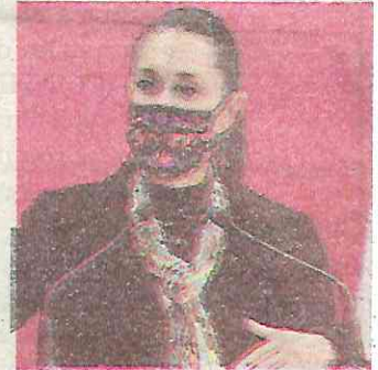
Responde a usuarios

Indicó que la Secretaría de Gobierno Capitalino, desde el inicio de los operativos de liberación de las estaciones, ya