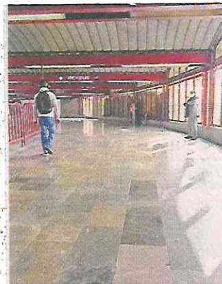
El STC informó que 65 estaciones fueron liberadas de comercio informal.

“Motivo por el cual, esta unidad administrativa no cuenta con registro alguno de número de comerciantes informales”, aseguró la Gerencia de Seguridad Institucional del STC.