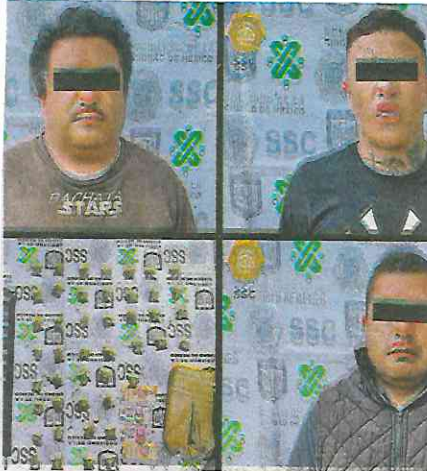
Traían aparente droga y son investigados por un presunto homicidio en Edomex