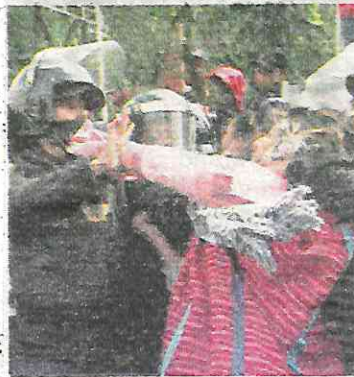
Trifulca entre indígenas y policías.