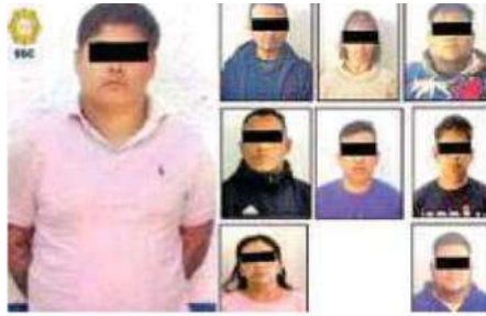
Los delincuentes operaban en la alcaldía Tláhuac