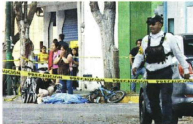
El accidente se registró en la esquina de la Calle Dr. Andrade y Dr. Miguel Silva, la tarde de ayer.