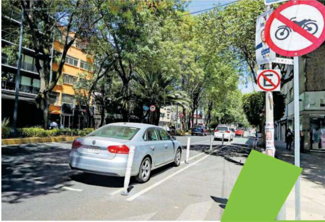
Los conductores se estacionan en doble fila