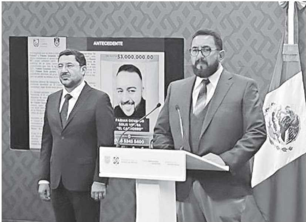
La Fiscalía capitalina trabaja con la Marina para encontrarlo de nuevo