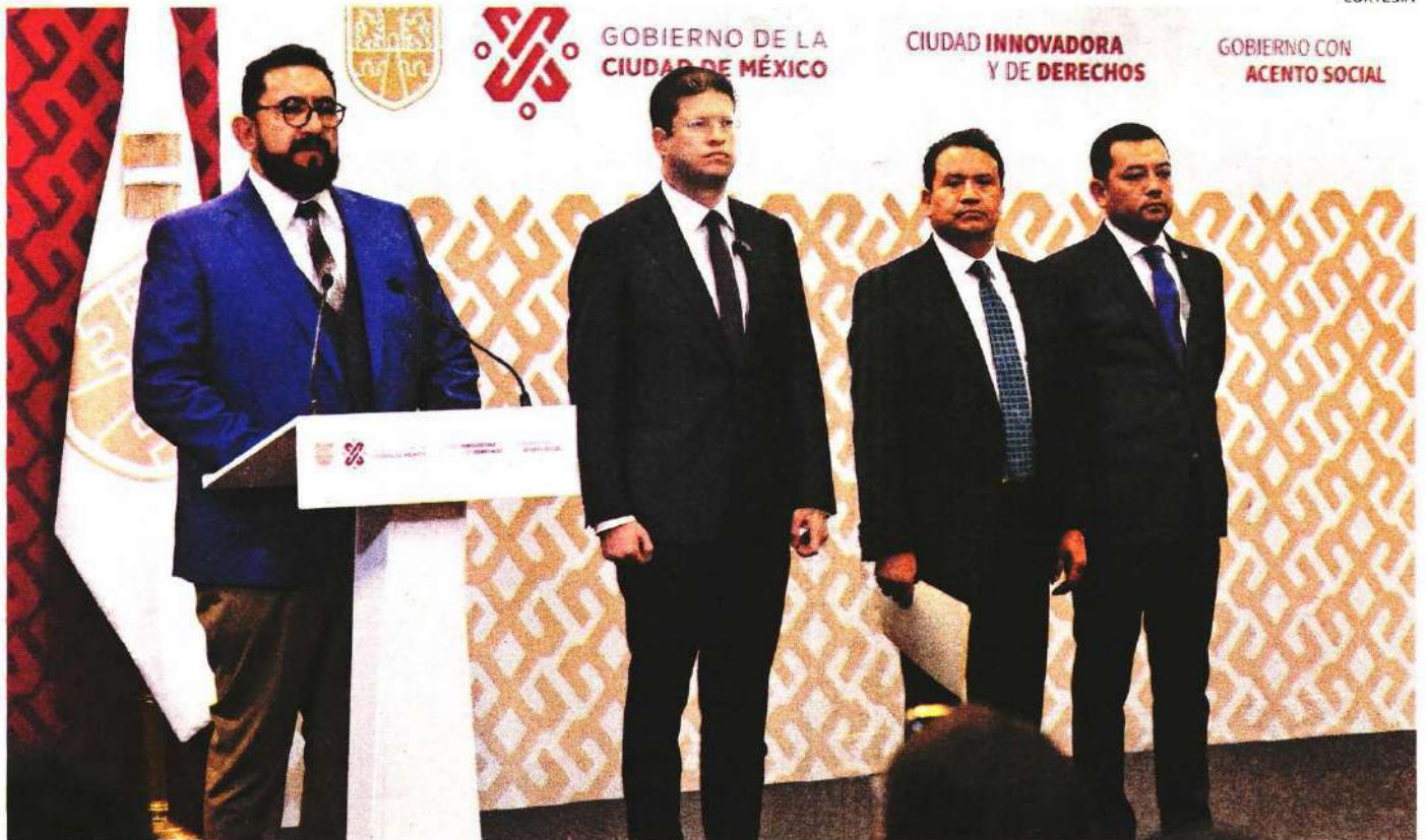
Autoridades trabajan en el caso del juez que dejó el libertad a un delincuente.