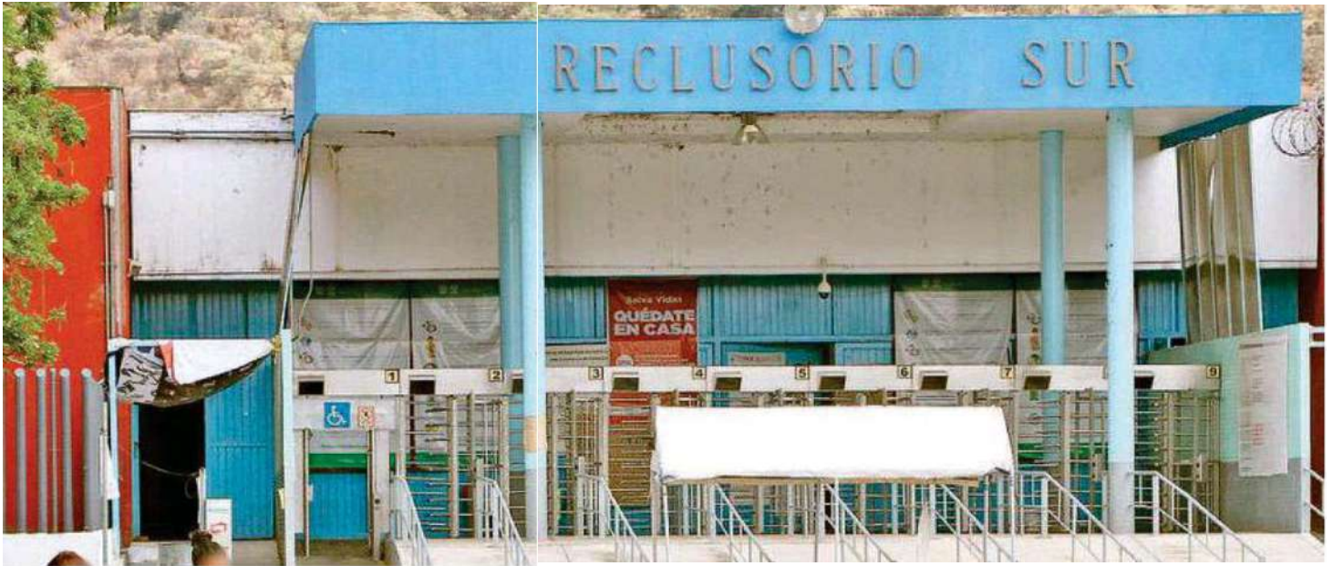
El Cachorro , salió por la puerta trasera del Reclusorio Sur.