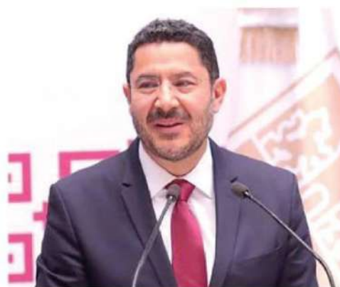
· Está Indignado por la decisión del magistrado