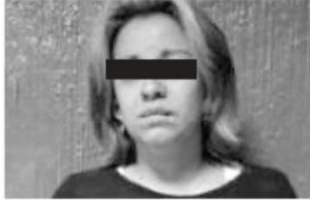
· Le ordenó a su marido el crimen

La fémina, quien azuzó a su esposo a que se cometiera el asesinato fue puesta a disposición del agente del Ministerio Público, quien definirá su situación jurídica.