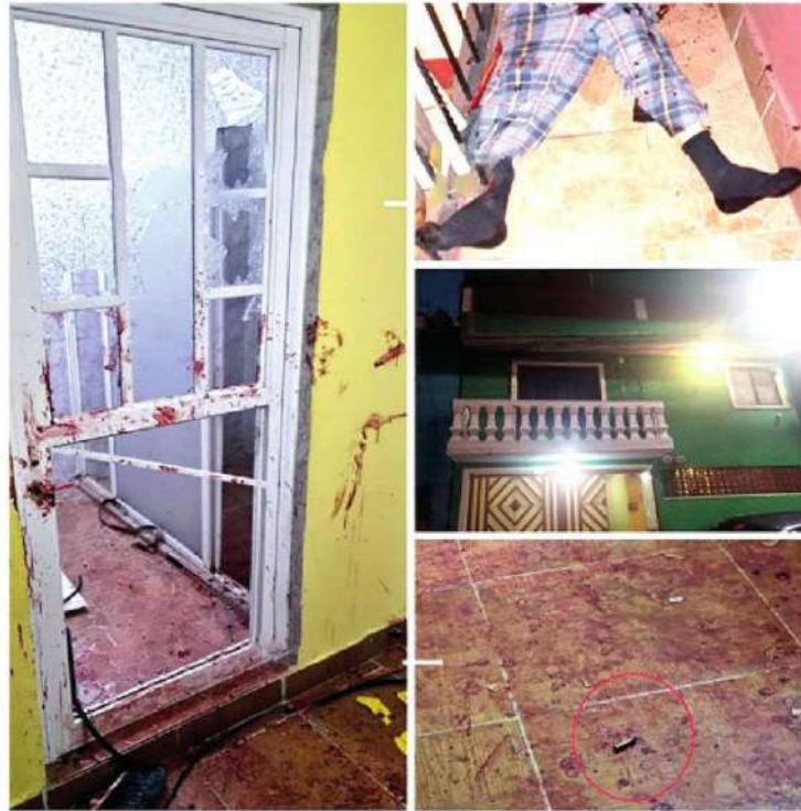
El hombre enloquecido casi acaba con la familia