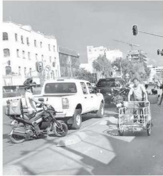
Destacan la importancia de crear conciencia en los automovilistas

La directora destacó la importancia de crear conciencia en los automovilistas y para ello este año la SSC CDMX realizará una campaña, principalmente en redes sociales, en la que llamen a los conductores a respetar las vialidades y a no estacionarse en lugares prohibidos.