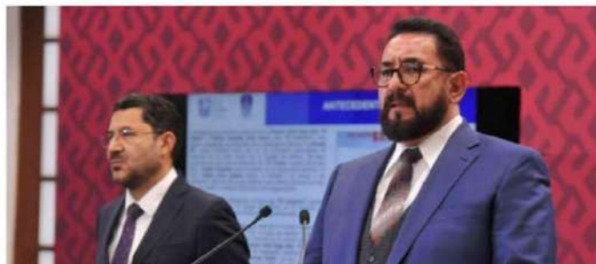
A pesar de que el juez tenía conocimiento de que "El Cachorro" es un líder delincriminal de alta peligrosidad, ignoró las incriminaciones que otorgó el Ministerio Público.

El criminal fue ingresado al Reclusorio Preventivo Varonil Sur, sin embargo, la autoridad judicial calificó como ilegal la detención. En su audiencia celebrada el día seis del mismo mes, agentes de la Policía de Investigación (PDI) de la FGJCDMX, esperaban al sujeto en el acceso principal del juzgado, aunque éste ya no se encontraba dentro del inmueble. (Jorge Aguilar)