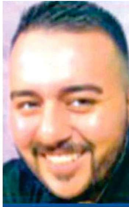
Fabián Osvaldo N es uno de los cinco generadores de violencia más peligrosos de la CdMx

El titular de la SSC dijo que trabajarán con la generación de inteligencia y actos de investigación que ayuden, a la detención de estos presuntos generadores de violencia importantes