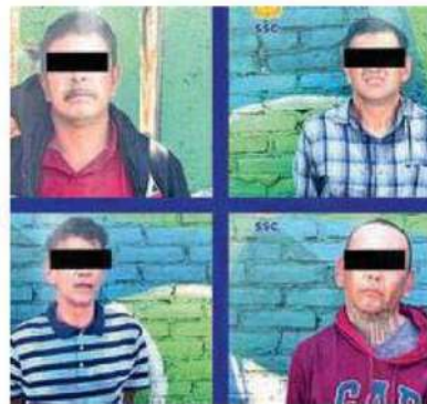
Fueron detenidos a la altura de las calles Nochebuena y Gardenias, de la colonia El Rosario

Al contar con las características de los posibles agresores, los oficiales de inmediato implementaron un dispositivo de localización y búsqueda con el apoyo de las cámaras de videovigilancia del C2 Oriente, hasta ubicarlos a la altura de las calles Nochebuena y Gardenias, de la colonia El Rosario, en la misma demarcación.