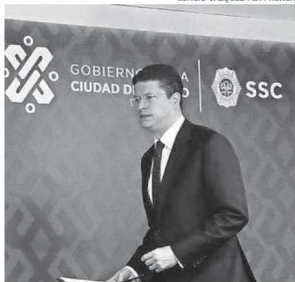
Pablo Vázquez informó sobre las capturas