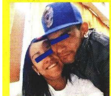
Está es la pareja involucrada.