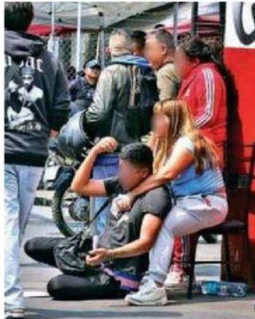
Familiares sufrieron una impresión por demás impactante

La carpeta de investigación que realizó el agente del MP quedó bajo el rubro de homicidio por tránsito vehicular dejando asentado lo que la policía reportó; mientras que el conductor quedó a disposición de la autoridad ministerial, donde se determinará su grado de responsabilidad.