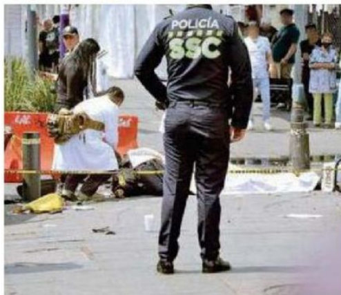
El presunto responsable quedó a disposición de la autoridad ministerial