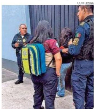
La joven mostraba signos de agotamiento extremo

Paramédicos del SAMU acudieron y brindaron atención médica en el sitio, confirmando que, pese a su estado físico deteriorado, la joven no requería traslado urgente a un hospital. Serán las autoridades y el avance de las investigaciones los que determinen si efectivamente se trató de un secuestro, así como la identidad de los posibles responsables.