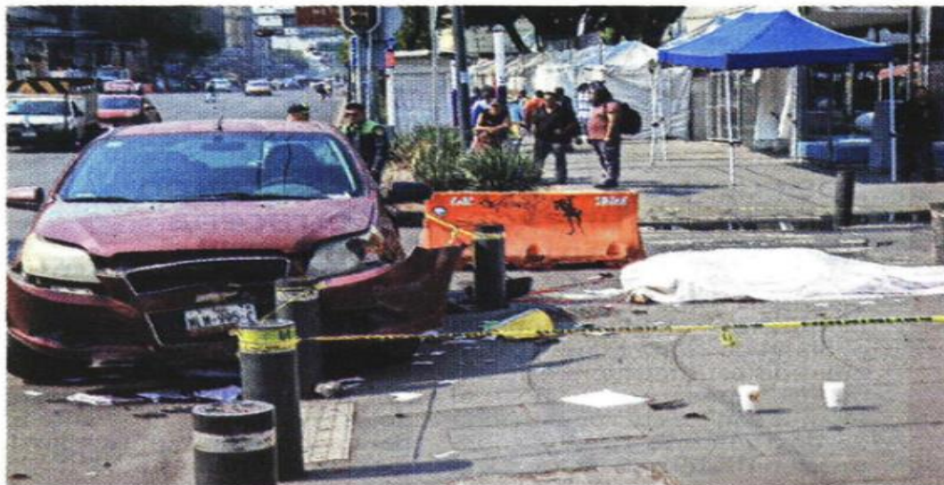
Familiares del biker llegaron al sitio para identificar los restos de la víctima.

La conductora responsable fue trasladada a un hospital en calidad de detenida, en tanto la Fiscalía capitalina inició una carpeta de investigación para esclarecer las causas de este accidente.