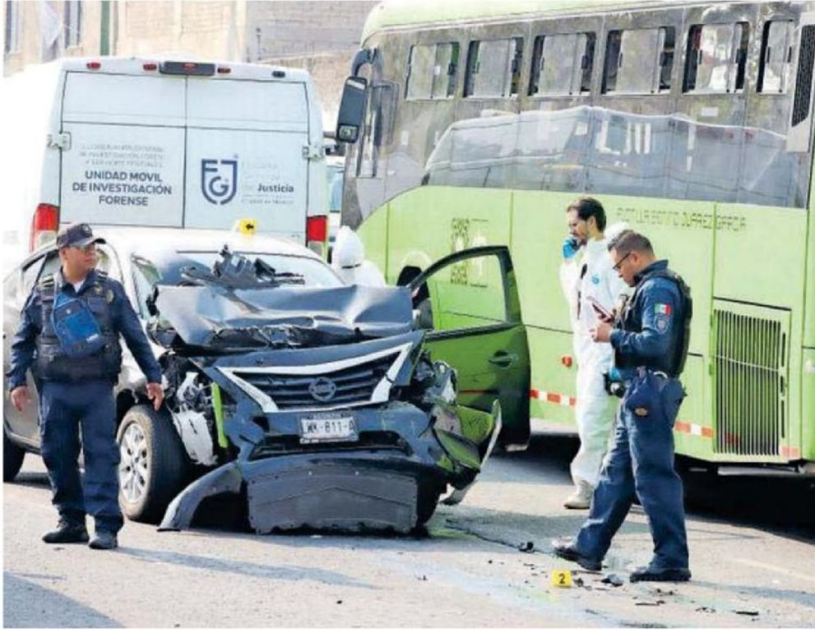
Un automóvil particular y un transporte de RTP tienen un percance en una calle de la Ciudad de México