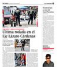
El fatídico accidente se registró en el Eje Central Lázaro Cárdenas, en la colonia Guerrero