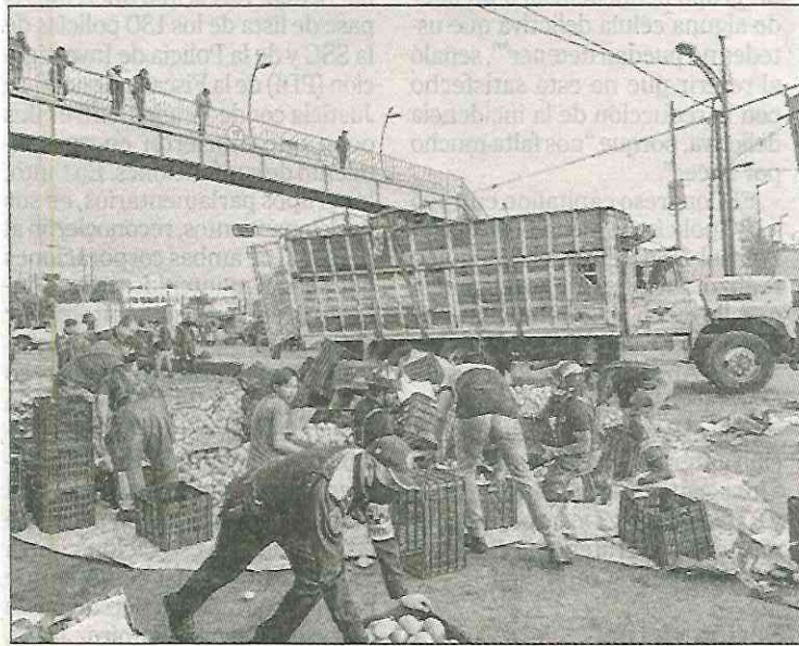
▲ Un camión que transportaba mangos volcó cuando circulaba sobre el Eje 6 Sur, frente a la Central de Abasto. Bomberos y elementos de la Secretaría de Seguridad Ciudadana ayudaron a recoger el fruto.