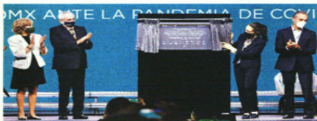
La placa de reconocimiento que quedará en el lugar resume el esfuerzo: 8 mil 500 pacientes atendidos en 413 días.