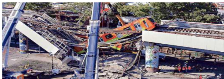
Al menos 16 empresas están involucradas en la demanda interpuesta en Nueva York.

Los "conservadores", aseguró, utilizaron la tragedia ocurrida en la Línea 12 del Metro -que cobró la vida de 26 personas- con propósitos electorales.