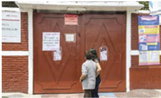
La Escuela Secundaria Técnica No. 80, en Tláhuac, permanece cerrada tras reportar el primer contagio.

Por ello, la comunidad educativa del mencionado plantel decidió, como medida preventiva, de manera voluntaria y en libertad, seguir con