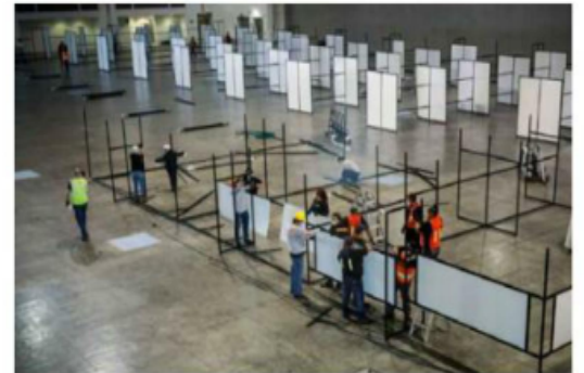
Concluye la operación de la Unidad Temporal Centro Citibanamex.

"Aquí se atendió a ricos y se atendió a quien no tenía recursos económicos sin cobrarle absolutamente nada por la atención de la salud. Aquí se mostró que la división, el clasismo y el racismo no llevan a ningún lado. Aquí se mostró que la atención es única, aquí se mostró el alma de los habitantes de la Ciudad de México, que siempre será la solidaridad y el apoyo mutuo."