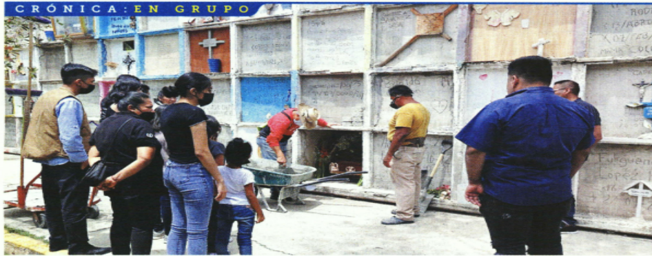
QUÉ TIEMPOS. En los momentos más críticos, hasta los músicos tenían que ayudar a cerrar gavetas.

A los trabajadores del panteón de Neza les preocupa el exceso de confianza de algunos deudos