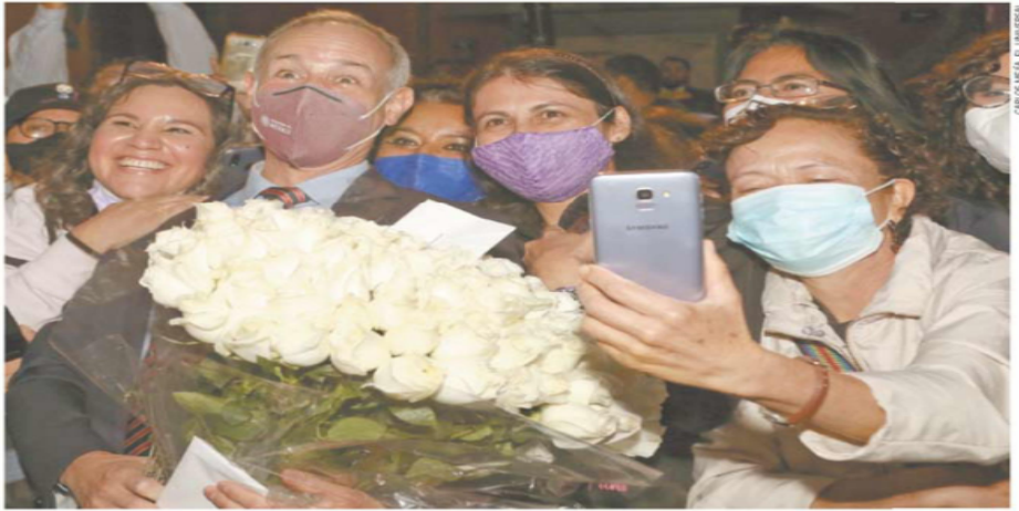
Al terminar su última conferencia vespertina diaria, que cierra con saldo de 229 mil 821 muertos de Covid-19 en México, el subsecretario Hugo López-Gatell se tomó tiempo para recibir flores y un pastel en medio de una serenata con mariachi. | NACIÓN | A9