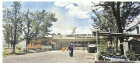
La chimenea del camposanto representa un problema, pues el humo termina en la parte baja.