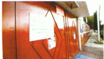
En la Secundaria Técnica No. 80, en Tláhuac, se dio el primer caso Covid tras el regreso a clases.

Por tal motivo, la comunidad educativa de dicho plantel decidió, como medida preventiva, seguir con las clases a distancia en lo que se realizan