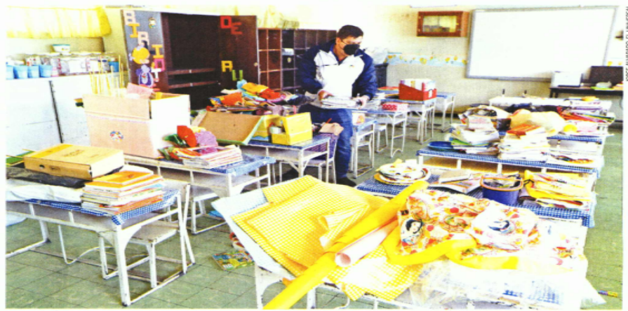
Aunque profesores y directivos de la Primaria Vicente Villada han realizado limpieza y le han dado mantenimiento al plantel, los padres de familia se niegan a mandar a sus hijos y optarán por la modalidad a distancia.

Secretario de Educación anticipa que la mitad de los 3.3 millones en nivel básico volverá a la escuela el lunes; en una primaria de Toluca, 42 de mil estudiantes asistirán pues padres temen contagios Covid-19