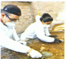
Los trabajos periciales comenzaron el 17 de mayo.

La Institución subrayó que una vez que concluya este proceso, los peritos expertos en genética iniciarán la etapa de extracción, purificación, cuantificación, amplificación y tipificación, para la obtención de un perfil genético y el electroferograma correspondiente a las muestras de los restos óseos.