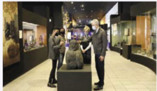
TOLUCA, Edomex.- Alfredo Del Mazo. El Centro Cultural Mexiquense es un espacio moderno y seguro.

La renovación de las seis salas de este espacio forma parte del fortalecimiento del Centro Cultural Mexiquense, donde la actual administración concluyó la construcción del Nuevo Conservatorio de Música y de la Cineteca Mexiquense, además de la restauración del Museo Hacienda la Pila y del Museo de Arte Moderno.