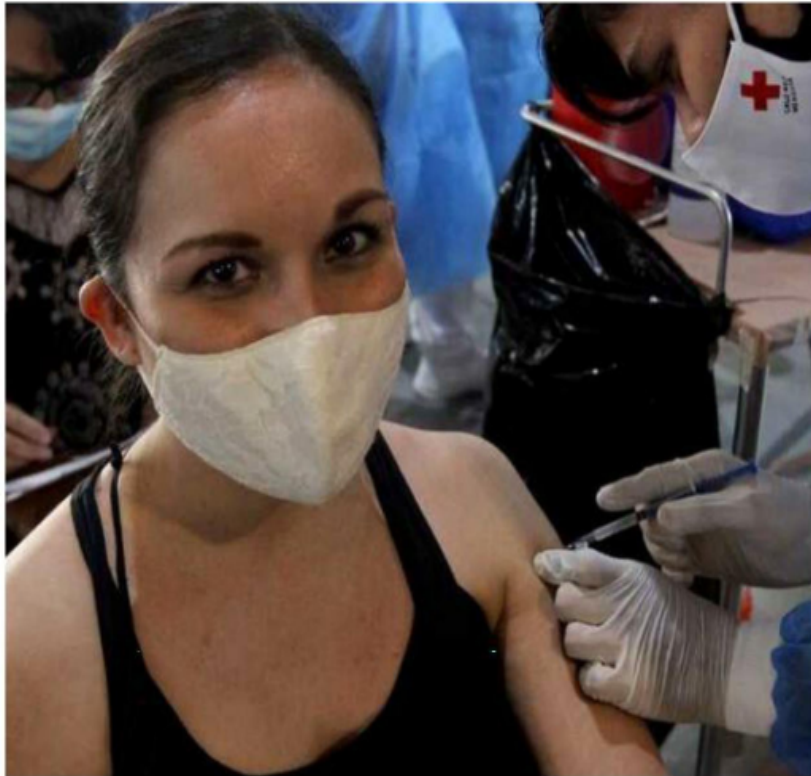
Los mexicanos entre 30 y 39 años de edad empezarán a ser vacunados a finales del mes de julio.

El fallo en el sistema no significa que los jóvenes se hayan saltado la fila o que ya les toque vacuna