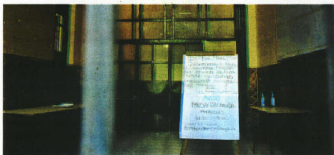
La asistencia a las escuelas en la capital mexicana sigue siendo voluntaria

Al señalar que en los tres casos las comunidades escolares decidieron voluntariamente continuar en línea, la doctora Oliva López precisó que las escuelas públicas donde se presentaron los contagios