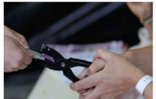
Se culminó con la instalación del 99.93% de las casillas.

Para la integración de las 162 mil 570 Mesas Directivas de Casilla se contó con el nombramiento de 1 millón 462 mil 672 personas entre propietarios y suplentes que recibieron su nombramiento expedido por los Consejos Distritales del INE en todo el país, mismos que aceptaron de puño y letra.