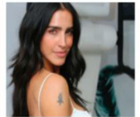
Influencers. Romplieron la veda electoral y ahora están en líos.

Destacó que el PVEM sería multado con 10 mil días de Salario Mínimo y reducción de hasta el 50% de su financiamiento. PAG 6