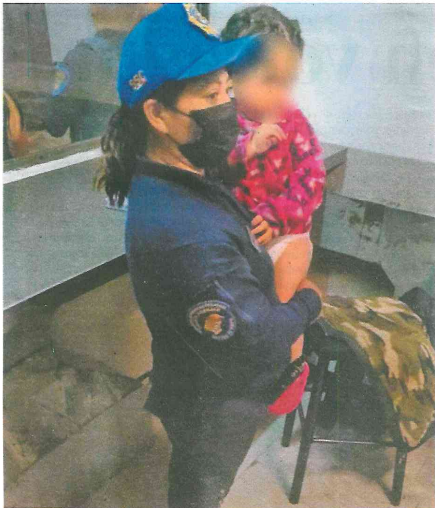
Aún no ha sido identificada, mas está a resguardo; investigan paradero de familiares