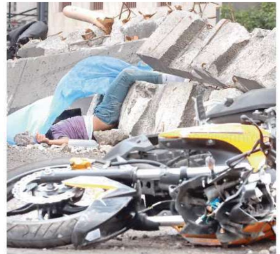
Al chocar con uno de los escombros su cuerpo salió proyectado contra los bloques de concreto destruidos donde quedó inmóvil