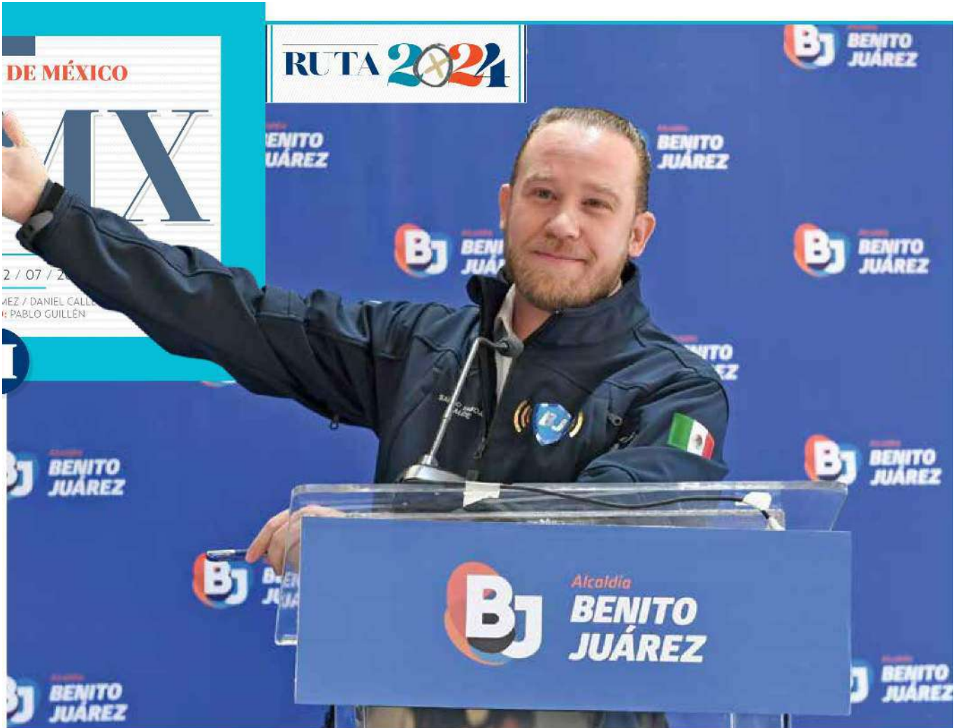
PASO A PASO | • PROCESO. El alcalde de Benito Juárez dice que va a decidir cuando se dé a conocer el método definitivo.

5 • Se ha logrado retomar la confianza, destacó.