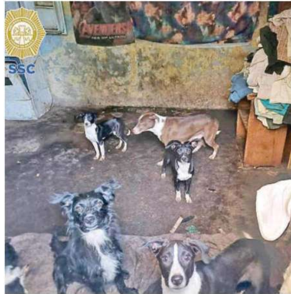
Fueron encontrados 18 perros vivos, nueve machos y nueve hembras

A la persona mencionada en este comunicado se les presume inocente y será tratada como tal en todas las etapas del procedimiento.