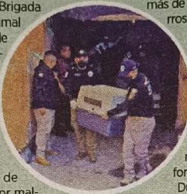
■ Nueve machos y nueve hembras fueron trasladados a un centro de control canino.