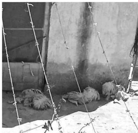
- Los lomitos estaban en condiciones precarias