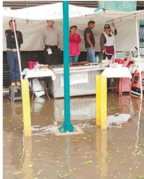
El agua afectó a negocios y clientes