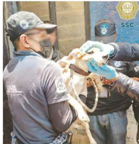
Los animales fueron resguardados