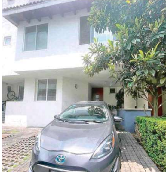
El robo en la casa del expresidente Felipe Calderón es investigado por la Fiscalía

Al respecto, la Fiscalía General de Justicia de la Ciudad de México (FGJCD-MX) informó que integra una carpeta de investigación por la posible comisión del delito de tentativa de fraude, al tomar conocimiento del ingreso de una persona al domicilio del ex presidente Felipe Calderón.