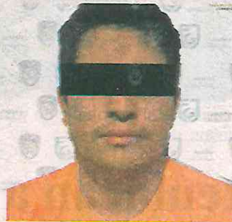
El Venado enfrentará proceso penal en reclusión, tras varios delitos

Lo anterior fue resuelto por el juzgador, tras calificar como legal la detención del individuo y luego de la imputación formulada por el representante social, adscrito a la Fiscalía de Investigación de Asuntos Relevantes. Durante la inspección oficial se aseguró más de un kilogramo de cocaí-