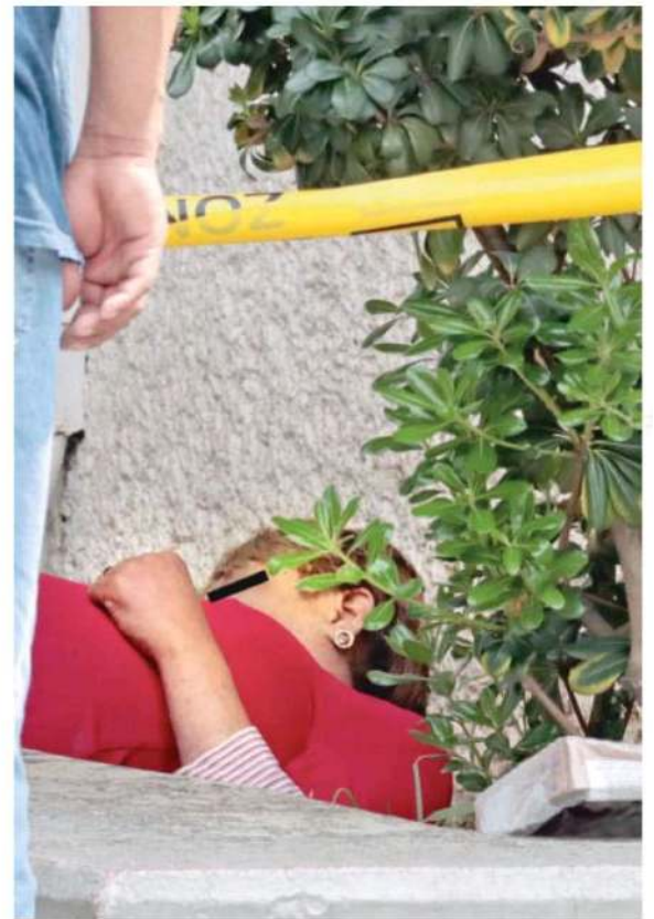
Al parecer la mujer vivía y dormía afuera del Hospital Xoco; hasta el momento se desconocen causas del deceso