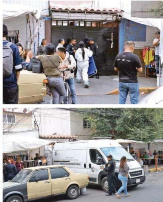
Asesinan a un hombre de siete tiros en Cerrada Fray Servando, colonia Tránsito