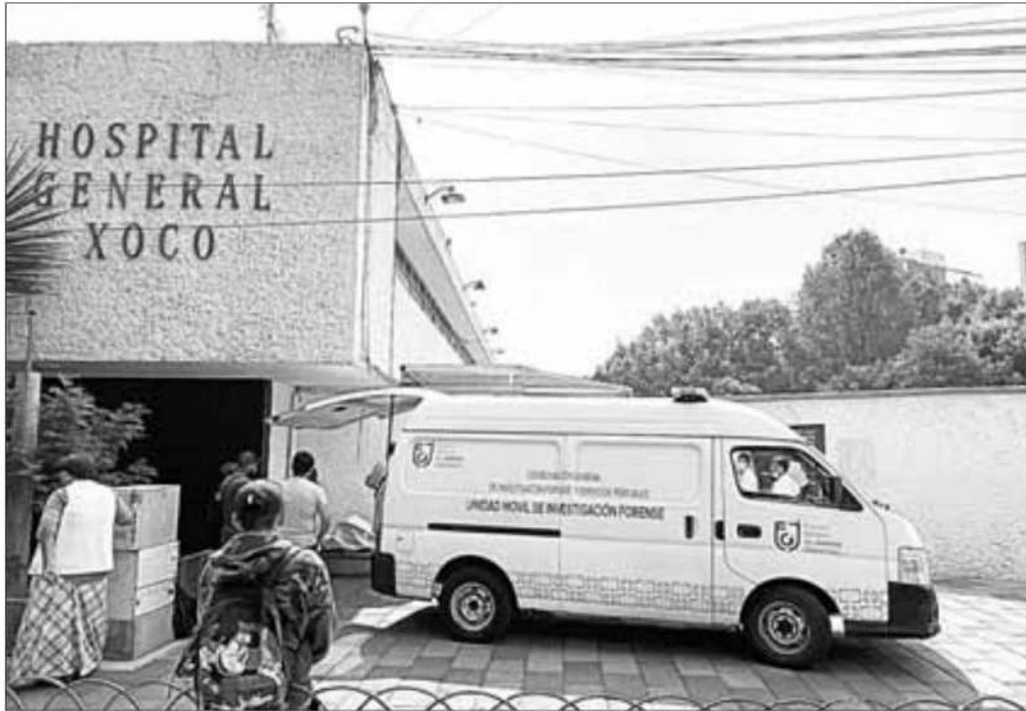
▲ Luego de levantar el cadáver de la adulta mayor, la fiscalía capitalina inició la investigación por el deceso.