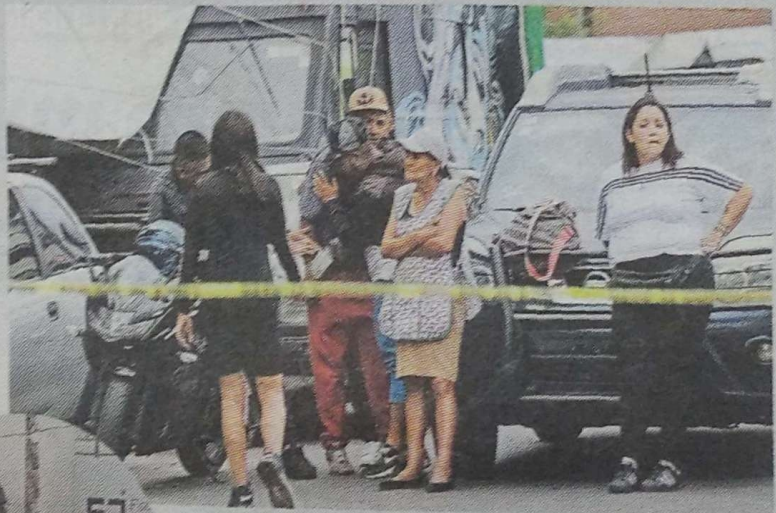
La madre del occiso entró en crisis al reconocerlo.

Aunque un grupo de paramédicos llegó al lugar de los hechos, el lesionado había muerto cuando lo iban a auxiliar.