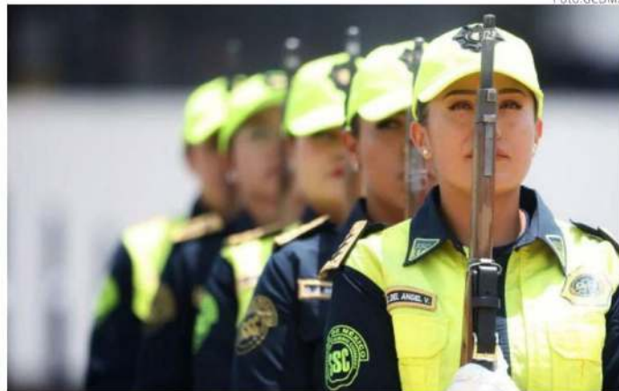
La percepción positiva sobre los policías ha mejorado 20 por ciento.