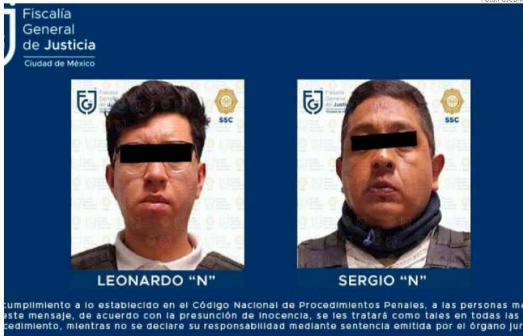
El acto de los servidores públicos identificados como Leonardo "N" y Sergio "N" estuvo fuera de la ley.