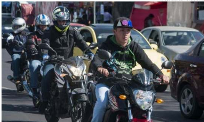
Conducir sin casco, una de las acciones más frecuentes.