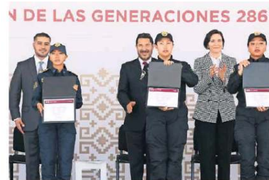
El jefe de la policía, Omar García Harfuch, pidió a los nuevos elementos conducirse con honestidad.

“Aquí se gradúan 127 mujeres y 127 hombres, exactamente la mitad, paridad exacta. En otra época podríamos tener generaciones integradas 100% por hombres”