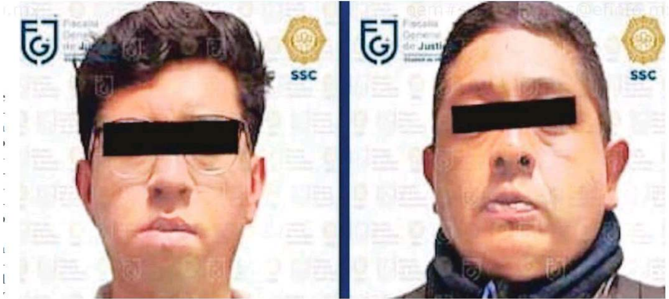
Será el miércoles cuando el juez determine vincular a proceso o no a los oficiales luego que la defensa de los policías pidiera la duplicidad de término