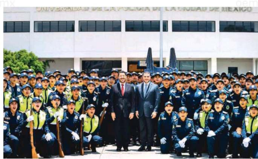
El jefe de Gobierno, Martí Batres y el titular de la SSC, Omar García Harfuch, con los graduados de la Universidad de la Policía