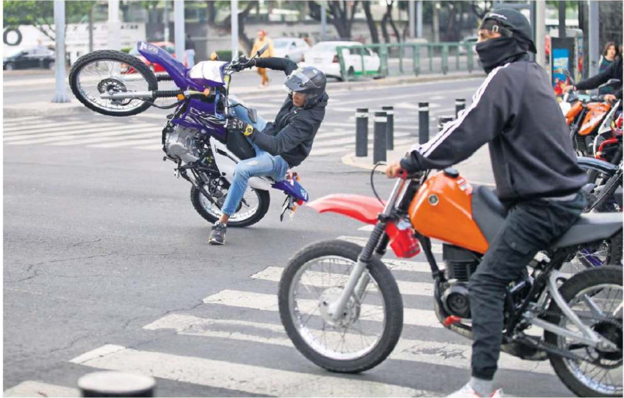
FRANCISCO RODRIGUEZ, EL UNIVERSAL