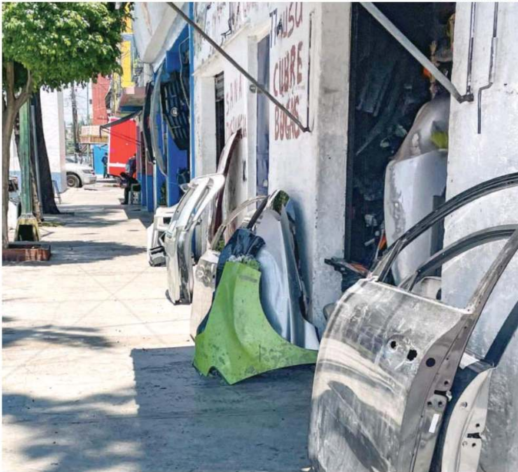
La colonia Buenos Aires fue considerada la refaccionaria más grande del mundo