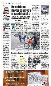
En un recorrido, EL UNIVERSAL observó que motociclistas incurren en faltas al Reglamento de Tránsito.