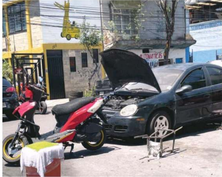
Del total de vehículos, apenas 70 por ciento cuentan con un seguro