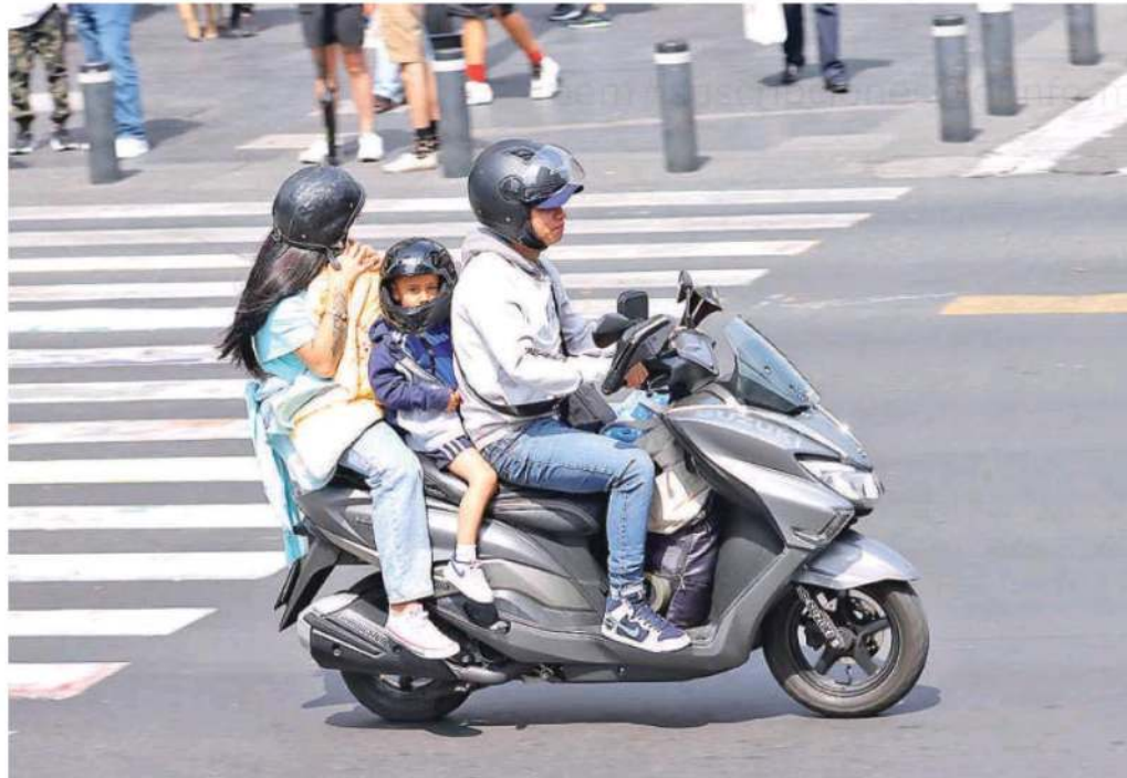
No se permitirá que niños ni bebés sean trasladados en potros de acero